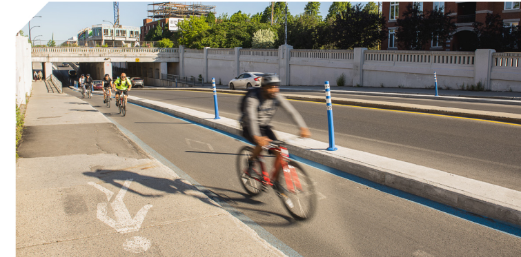
Ville de Montréal

Le Réseau express vélo (REV) constitue un réseau confortable et sécuritaire de voies protégées et accessibles toute l'année. Il s'agit d'un ambitieux projet qui prévoit la mise en service de 184 km de voies cyclables entre différents points d'intérêt sur toute l'île de Montréal.