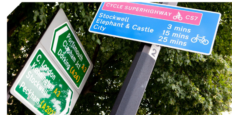
Barclays Cycle Superhighway signage for CS7

On trouve les Cycleways. Autrefois nommées Cycle Superhighways et Quietways, ces pistes cyclables de haute qualité relient les communautés, entreprises et destinations à travers Londres. Faciles à utiliser, elles permettent aux cyclistes de tous niveaux de se sentir en sécurité et en confiance.