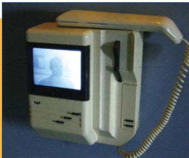
Interphone vidéo (vue de l'appartement)