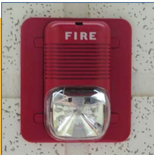
Alarme sonore avec système visuel de type stroboscopique