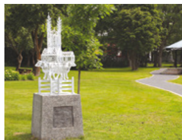
Luce Pelletier Repère commémoratif Site patrimonial de Charlesbourg