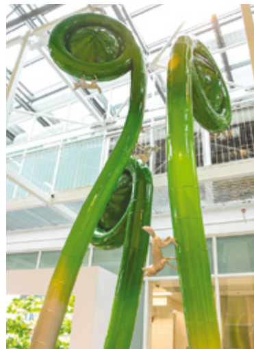
DEMERS-MESNARD Comment vivent les renards dans la clairière laurentienne Le Grand Marché de Québec, La Cité-Limoilou