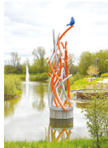
Hélène Rochette Le Veilleur Faubourg du Moulin, Beauport