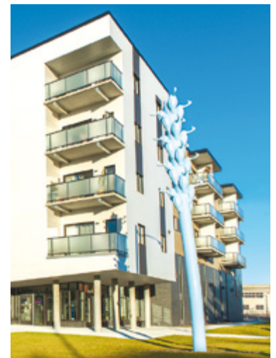
Cooke-Sasseville La trajectoire Centre communautaire du Jardin, Charlesbourg