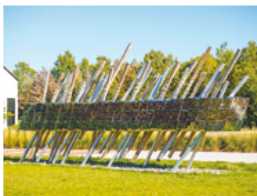
Ludovic Boney Lever de soleil sur le nord Base de plein air de Sainte-Foy