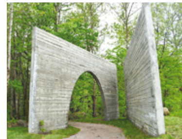
Luca Fortin Entre les lignes Parc Chauveau, Les Rivières