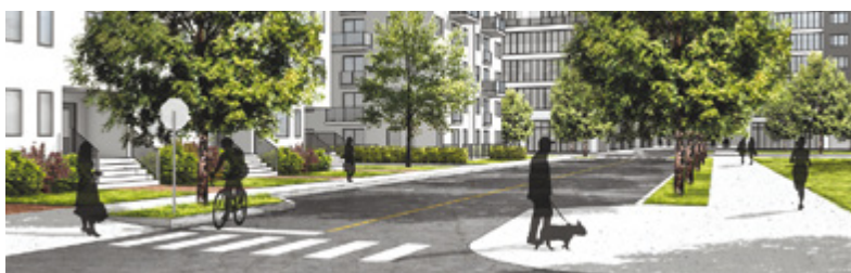
Vue d'un quartier résidentiel dans le secteur Chaudière.

Et pour en savoir plus sur la Vision de l'habitation, consultez le www.ville.quebec.qc.ca/visionhabitation ou lisez la page 8 de ce bulletin.