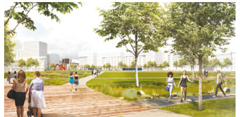
Concept du secteur du parc Victoria, une fois l'autoroute Laurentienne transformée en boulevard urbain.

Travaillées en tenant compte des orientations d'autres visions, comme la Vision de l'habitation, dévoilée tout récemment, ou la Vision de la mobilité active, dont la démarche de consultation publique vient d'être lancée, les visions d'aménagement répondent au souhait de la Ville et de ses citoyens de concevoir des milieux de vie durables et à l'échelle humaine, réfléchis en fonction de l'augmentation prévue du nombre de ménages et de la mobilité active.