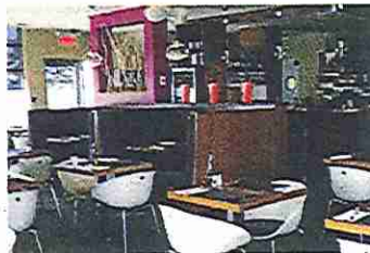
Le style épuré de la salle à manger est tout à fait actuel

Nous optons pour le menu du jour. Le choix d'entrée consiste d'un potage de carottes, d'une salade maison, grecque ou duo de