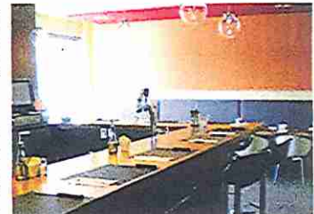
Un bar et une salle pour groupe privé se situent à l'étage

Les plans ont été dessinés par l'architecte augustinois Guy Fillion. Le propriétaire, ingénieur de formation et soucieux de l'environnement, souhaitait la construction d'un édifice écoénergétique. Notons également qu'un potager sera aménagé sur