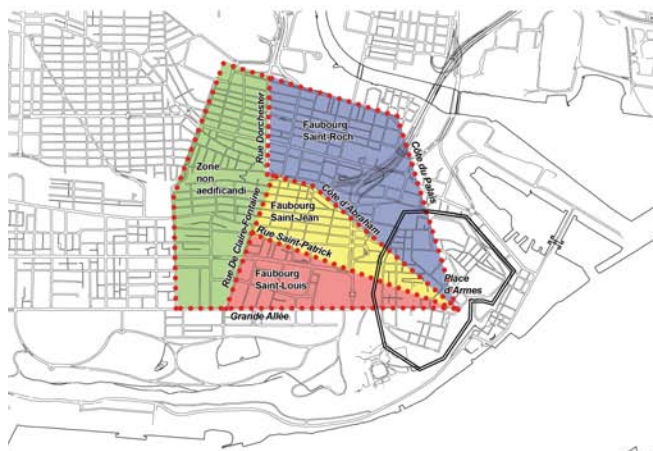
Limites d'origine des faubourgs de la ville de Québec