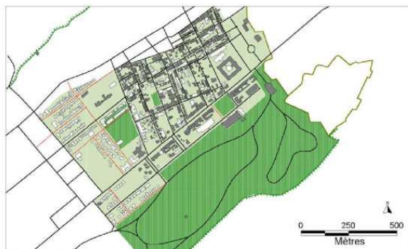
Figure 47. 1929