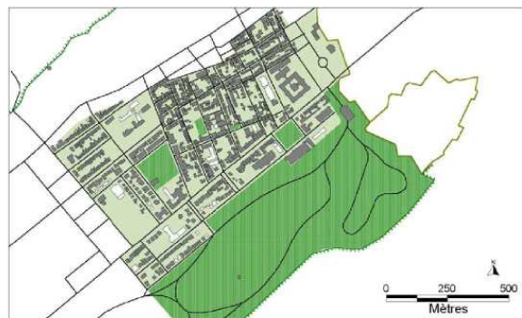
Figure 48. 1959