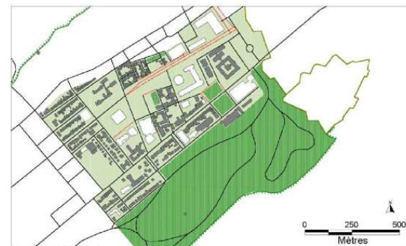
Figure 49. 1979