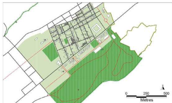
Figure 46. 1908