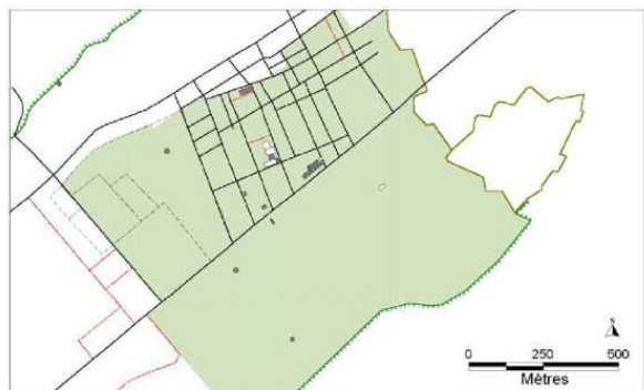
Figure 45. 1875