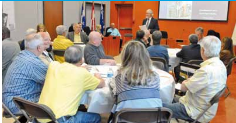
Le conseil de quartier participe à l'élaboration de projets visant à améliorer la qualité de vie de son quartier.

Pour poser sa candidature, il suffit simplement de se procurer un formulaire de mise en candidature au bureau d'arrondissement situé au 305, rue Racine. Il faut également obtenir l'appui de 10 personnes majeures, soit résidants ou résidentes ou représentant un établissement