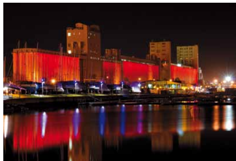
Laissez-vous emporter par l'ambiance féerique d' Aurora Borealis .

Pendant la période estivale, Aurora Borealis débute quelques minutes après la projection du Moulin à images .