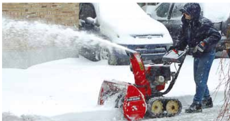
Sans permis, il est interdit de jeter de la neige dans la rue.

d'un permis spécial à cet effet. Avis aux contrevenants : les inspecteurs font preuve de vigilance et peuvent remettre des constats d'infraction au montant de 150$ (plus les frais).