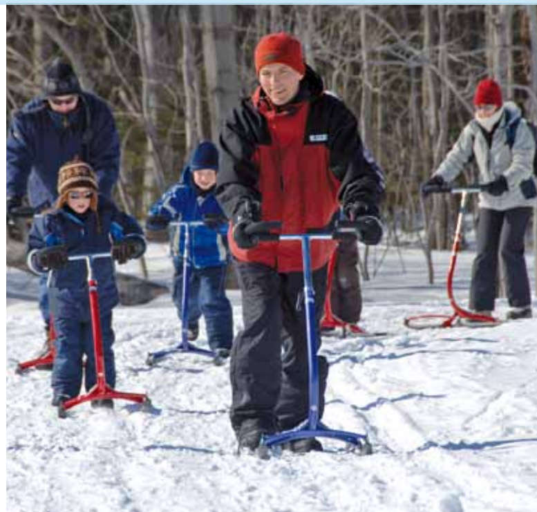
Profitez des nombreuses activités qui vous sont offertes durant la relâche scolaire pour vous amuser en famille.

au parc Montchâtel (La Haute-Saint-Charles)