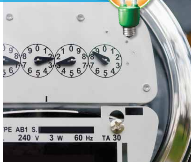
Le Diagnostic résidentiel MIEUX CONSOMMER : des économies d'énergie pour vous et de l'argent pour votre municipalité.

Pour obtenir plus d'information, consultez le site Internet de la Ville au www.ville.quebec.qc.ca , à la rubrique Sujets de l'heure .