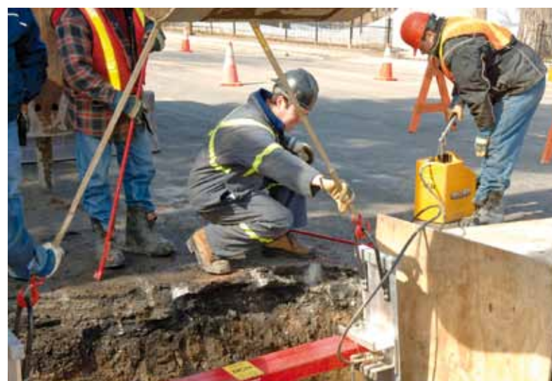
La réfection des infrastructures : une priorité pour la Ville qui y investira 563 millions $ en 2010.

Pour les trois prochaines années, les subventions gouverne-