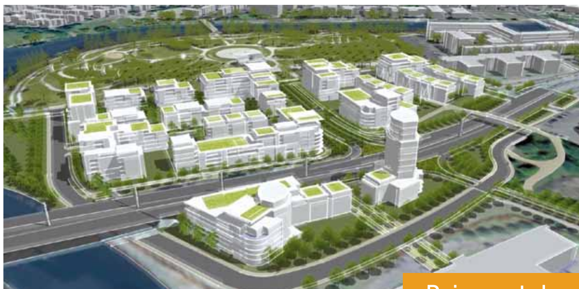
La Pointe-aux-Lièvres deviendra un écoquartier comprenant 1 200 logements et un grand parc en bordure de la rivière Saint-Charles.