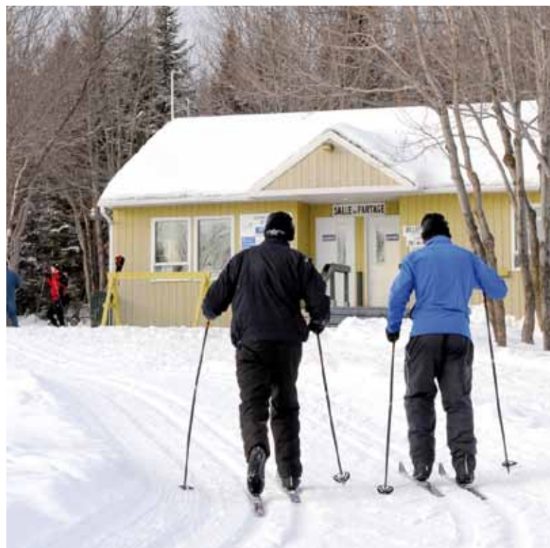
Ski de fond, raquette, observation des étoiles... la base de plein air de La Découverte vous propose de nombreuses activités.

La base de plein air de La Découverte est située au 1560, rue de la Découverte, dans l'arrondissement de La Haute-Saint-Charles. On y accède à partir de l'autoroute Henri-IV Nord, en prenant la sortie «Val-Bélair centre-ville.»