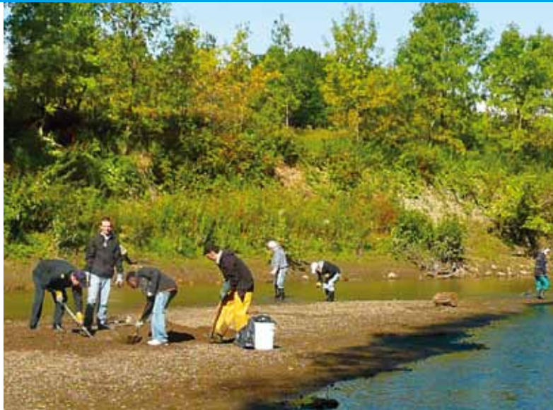
À l'automne 2009, plusieurs bénévoles ont participé au nettoyage des berges de la rivière du Berger. Avis aux intéressés : d'autres opérations seront également organisées en 2010.

Le Conseil de bassin de la rivière Saint-Charles et la Société de la rivière Saint-Charles ont mis sur pied un projet triennal (2009-2010-2011) visant à améliorer la qualité des habitats de la rivière du Berger. Pourquoi? Pour réhabiliter, sur le plan de la faune, une rivière qui a subi de nombreuses modifications depuis les changements de son parcours d'écoulement dans les années 1970.