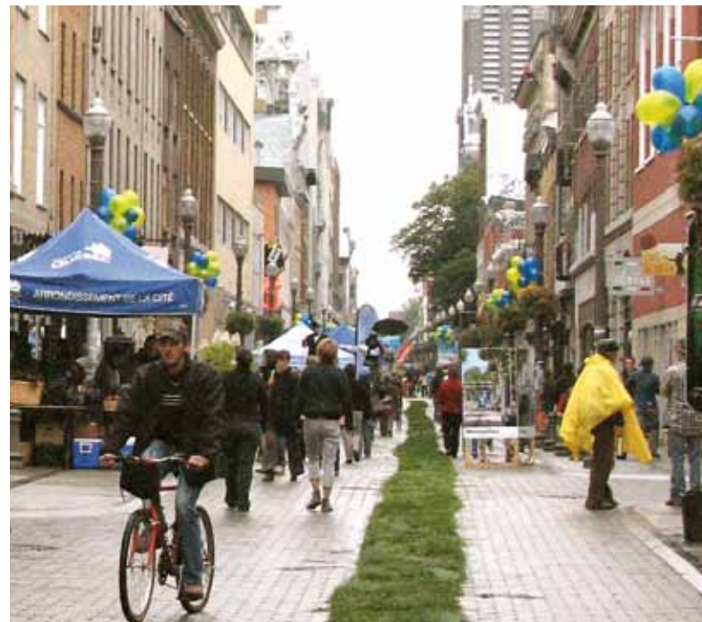
Activités et stands d'information animeront le quartier Saint-Roch au cours de la journée « En ville, sans ma voiture », le 22 septembre.

RTC : 800 et 801, ainsi que plusieurs parcours réguliers ( www.rtcquebec.ca )