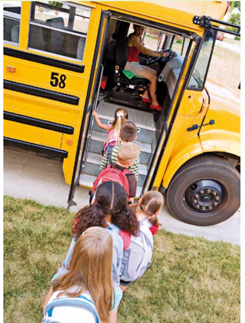
Pour favoriser une rentrée scolaire sécuritaire, la surveillance policière est accrue aux abords des écoles.

Pour obtenir plus de renseignements : www.ville.quebec.qc.ca . Consultez aussi notre dossier en page 5.