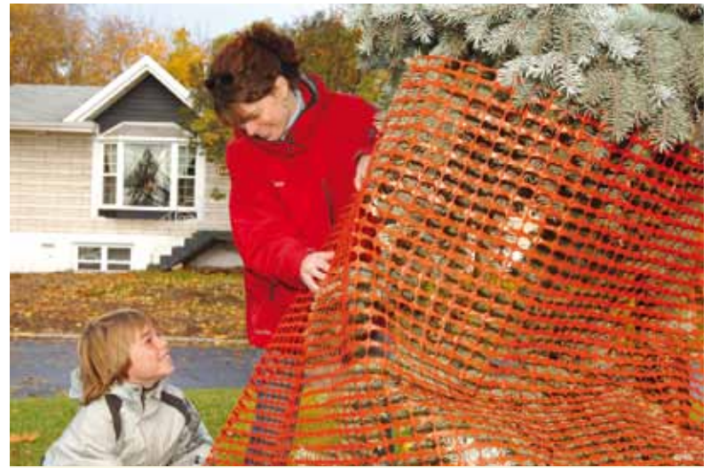
En prévision de la saison froide, procurez-vous le dépliant Protection hivernale : laissez-nous vous donner quelques conseils .

Le guide sur la protection des végétaux est disponible à l'hôtel de ville et dans les bureaux d'arrondissement. Vous pouvez aussi en prendre connaissance sur le site Internet www.ville.quebec.qc.ca/environnement , à la rubrique Arbres, plantes et faune .