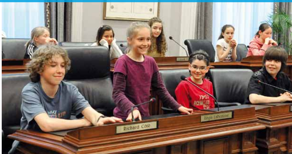
Le conseil municipal des enfants est une belle occasion de s'initier à la citoyenneté et à la vie démocratique.

Les écoles qui souhaitent y participer doivent s'inscrire sur le site Internet www.ville.quebec.qc.ca/conseilmunicipaldesenfants avant le 1 er novembre .