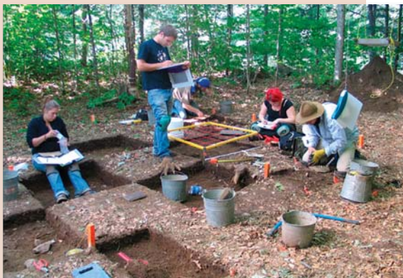
L'équipe de 2007 du chantier-école en archéologie préhistorique de l'Université Laval.