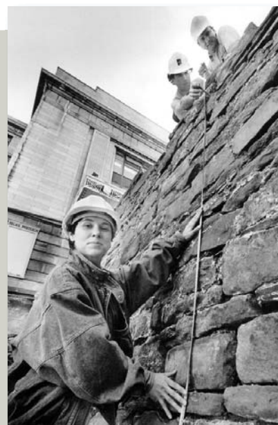
Le mur de contrescarpe élevé vers 1745. Le Soleil , 30 avril 1987, par André Pichette.

Les fortifications avancées devant la porte Saint-Jean. John Phillip Bainbrigg, Croquis représentant la rivière Saint-Charles vue d'au-dessus de la porte Saint-Jean , 16 novembre 1836, Bibliothèque et Archives Canada, C-011871.