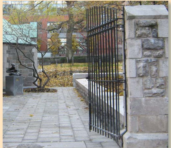
Le cimetière St. Matthew a fait l'objet d'une restauration complète en 2009.