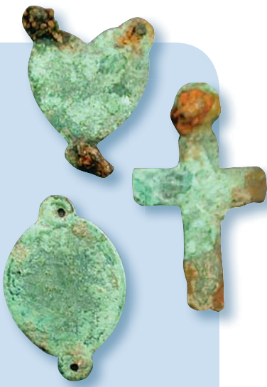
Médailles et croix de chapelet. Ville de Québec, par Christian Roy.

La nouvelle place présente, outre l'Allée des bâtisseurs, un rappel au sol des fondations de l'église disparue.