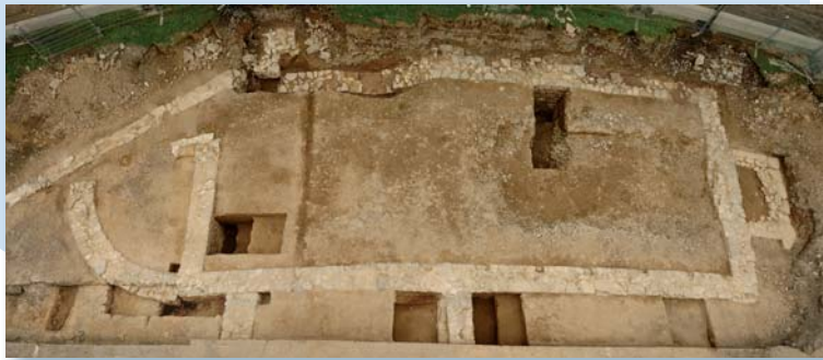
Vestiges de la première église en pierre. Ville de Québec, par Christian Dionne.

25, avenue du Couvent Arrondissement de Beauport