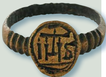
Les missionnaires distribuèrent ces bagues, dites « jésuites », pour récompenser la piété de leurs élèves amérindiens. Ministère de la Culture, des Communications et de la Condition féminine du Québec, par Marc Laberge.