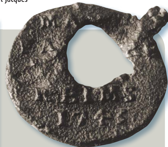
Sceau servant à certifier le contenu ou la provenance des ballots de marchandise. On peut y lire l'inscription « Reims 1743 ». Ville de Québec, par Brigitte Ostiguy.

Les fortifications avancées devant la porte Saint-Jean. John Phillip Bainbrigg, Croquis représentant la rivière Saint-Charles vue d'au-dessus de la porte Saint-Jean , 16 novembre 1836, Bibliothèque et Archives Canada, C-011871.