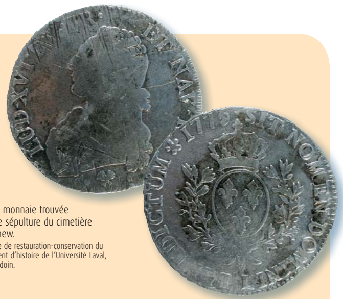
Pièce de monnaie trouvée dans une sépulture du cimetière St. Matthew.

755, rue Saint-Jean Arrondissement de La Cité-Limoilou 418 641-6798