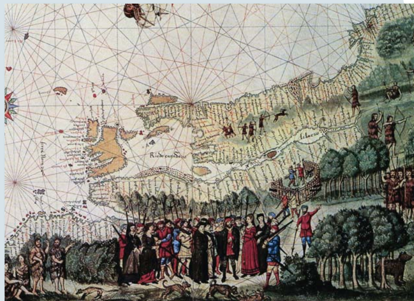
Carte tirée de l'atlas de Nicolas Vallard illustrant vraisemblablement les gens de l'expédition de Cartier ou de Roberval.

Les nouveaux sondages archéologiques serviront à documenter les éléments découverts et à déterminer ce que recèlent d'autres secteurs prometteurs.