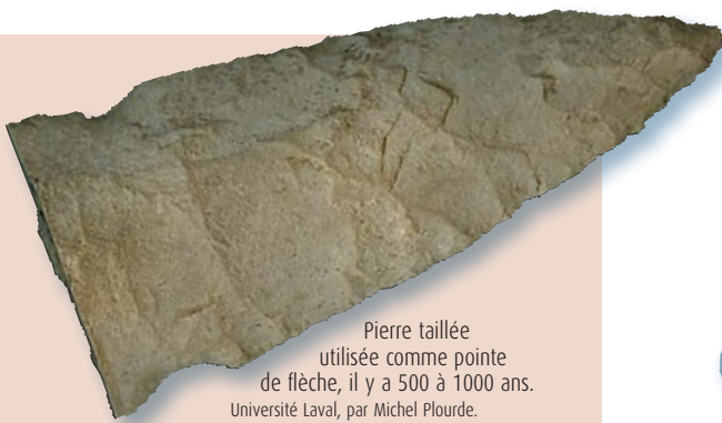
Pierre taillée utilisée comme pointe de flèche, il y a 500 à 1000 ans. Université Laval, par Michel Plourde.

Les outils de pierre démontrent par ailleurs l'étendue du réseau d'échange amérindien. La matière première provient de lieux aussi éloignés que Mistassini, le Labrador ou la portion des Appalaches comprise entre le lac Ontario et le lac Érié. L'abondance du quartzite de Mistassini suggère une affiliation sinon une parenté entre les Amérindiens qui s'arrêtaient au lac Saint-Charles et les groupes de chasseurs-cueilleurs algonquiens de la région du lac Saint-Jean.