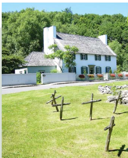
Rappel du cimetière amérindien et vue partielle des fondations de la chapelle Saint-Michel devant la Maison des Jésuites. Maison des Jésuites.

Cet été, le réaménagement du terrain de la Maison des Jésuites donnera l'occasion d'en savoir plus. Quant à l'hôpital des Hospitalières, la superposition à la trame urbaine actuelle d'un plan de l'ingénieur Robert de Villeneuve, daté de 1685, le situe dans une anse du fleuve un peu plus à l'ouest. L'archéologie tranchera-t-elle un jour?