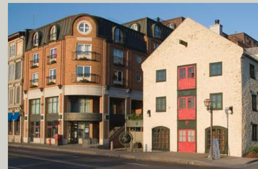
L'Auberge Saint-Antoine. Auberge Saint-Antoine.

L'Entente de développement culturel a contribué à la recherche archéologique, à la mise en valeur des vestiges et des objets ainsi qu'à la publication du livre Un passé plus-que-parfait . Ce dernier résume l'histoire de l'îlot Hunt et décrit le savant mélange de présent et de passé qui préside à l'aménagement de l'établissement hôtelier.