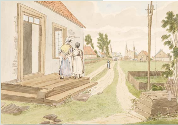
Sur cette aquarelle de 1830, la première église en pierre de la paroisse de Saint-Charles-Borromée et l'église actuelle coexistent. James Pattison Cockburn, Village of Charlesbourg , Musée royal de l'Ontario, ROM-7694.

Intersection du boulevard Louis-XIV et de la 1 re Avenue Arrondissement de Charlesbourg