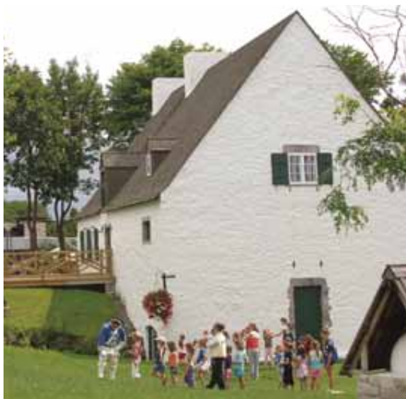
Le Moulin des Jésuites, une visite qui vaut le détour !