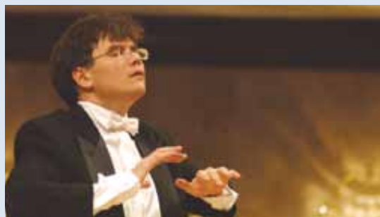
Le maestro Airat Ichmouratov

Depuis septembre 2008, l'Orchestre symphonique de Québec (OSQ) offre une série de concerts dans les arrondissements. Soutenue par l'Entente de développement culturel et le Bureau de la Capitale nationale, cette série vous offre l'opportunité d'entendre l'OSQ à deux pas de chez vous.