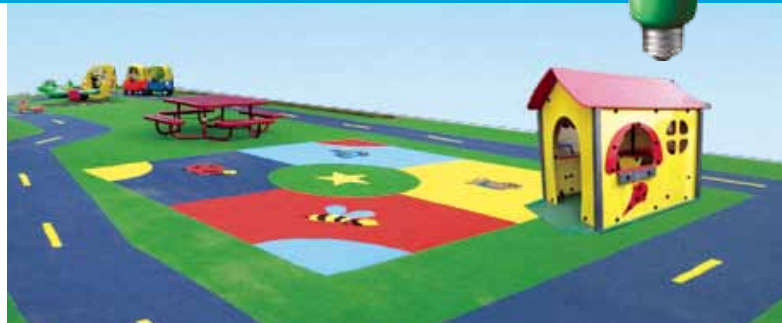
Croquis présentant les améliorations apportées au parc : ajout de jeux et installation d'un revêtement de sol sécuritaire.

En effet, c'est simple et payant pour notre collectivité : le résident n'a qu'à remplir le questionnaire du diagnostic résidentiel à l'adresse www.courantcollectif.com qui permet d'obtenir une évaluation énergétique personnalisée de sa résidence et de ses appareils. Cette évaluation gratuite est réalisée à partir des réponses au questionnaire et donne droit à un rapport de recommandations visant à réduire sa consommation d'énergie.