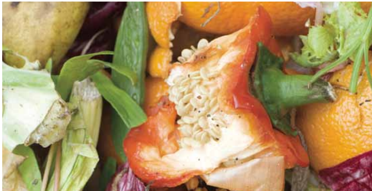
Plus de 40 % du contenu de nos poubelles est composé de matières organiques pouvant être compostées.

Ces nouveaux équipements permettront à la Ville de composter annuellement près de 85 000 tonnes de matières organiques. Une quantité considérable de déchets pourront donc être détournés de l'incinération.