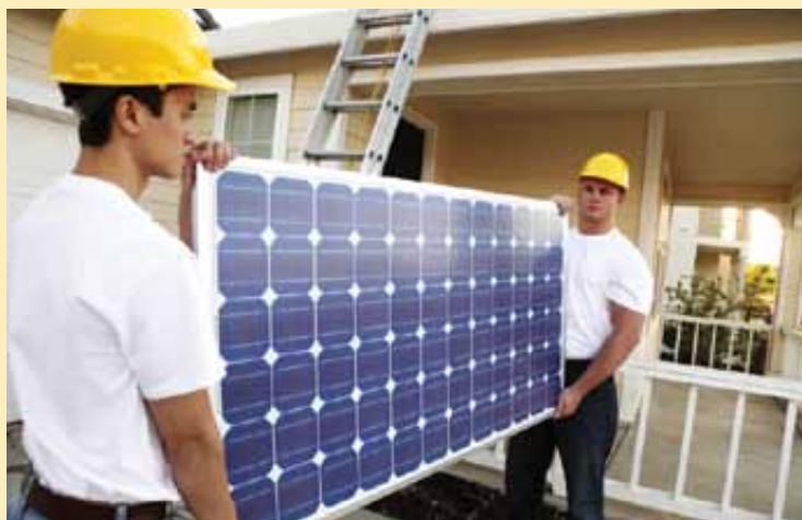
Si vous prévoyez installer des panneaux solaires sur votre propriété, informez-vous d'abord des normes à respecter.

Avant de sortir scie et marteau, vérifiez auprès de votre arrondissement si les travaux prévus nécessitent un permis de construction. Si c'est le cas, on vous indiquera la marche à suivre et les documents à fournir pour l'analyse de votre demande, comme des plans de vos travaux.