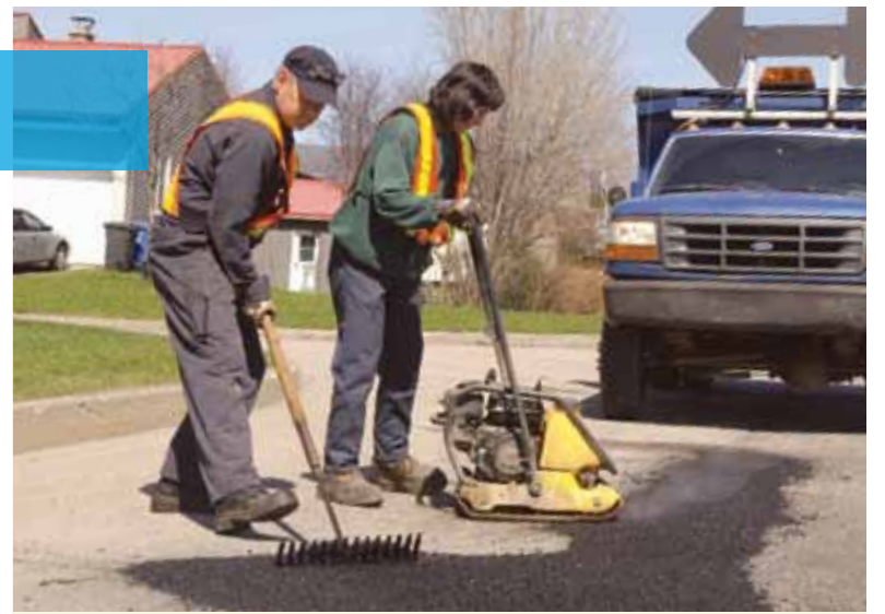
Aidez-nous à traquer les nids-de-poule en les signalant à votre arrondissement.

Vous pouvez aussi signaler ces nids-de-poule par l'entremise du www.ville.quebec.qc.ca , à la rubrique Sujets de l'heure .