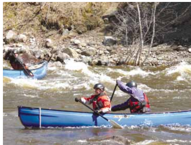
Vagues-en-ville : une activité à ne pas manquer les 24 et 25 avril prochain aux abords de la Saint-Charles!

Renseignements : Société de la rivière Saint-Charles, au 418 691-4710, ou www.societerivierestcharles.qc.ca .