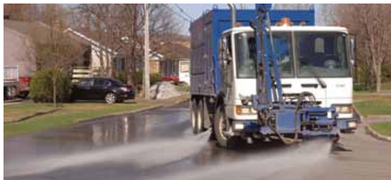
Durant le grand ménage printanier, le stationnement sera interdit dans certains secteurs afin de faciliter les opérations. Surveillez la signalisation!

Vous serez informé de la date et des heures prévues pour les