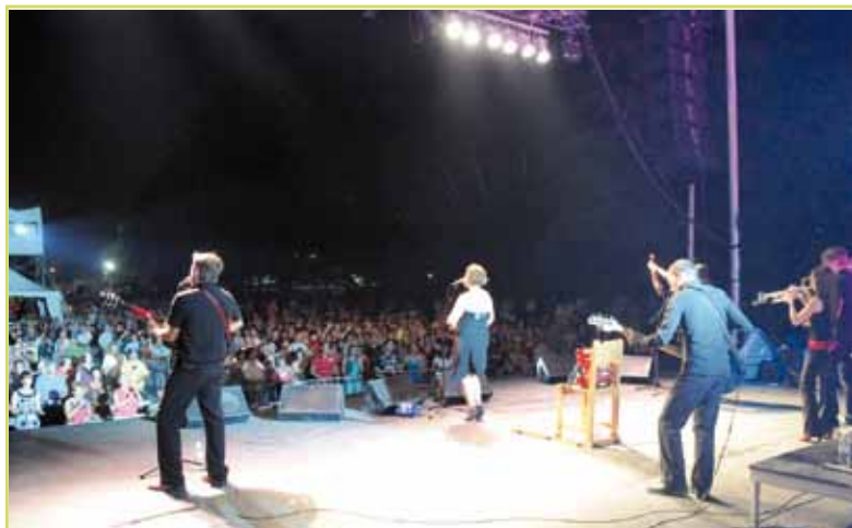
Près de 5 000 personnes ont assisté aux spectacles lors de la fête familiale tenue le 15 août dans le cadre du 375 e anniversaire de Beauport : quel succès !

Renseignements : www.journeesdelaculture.com