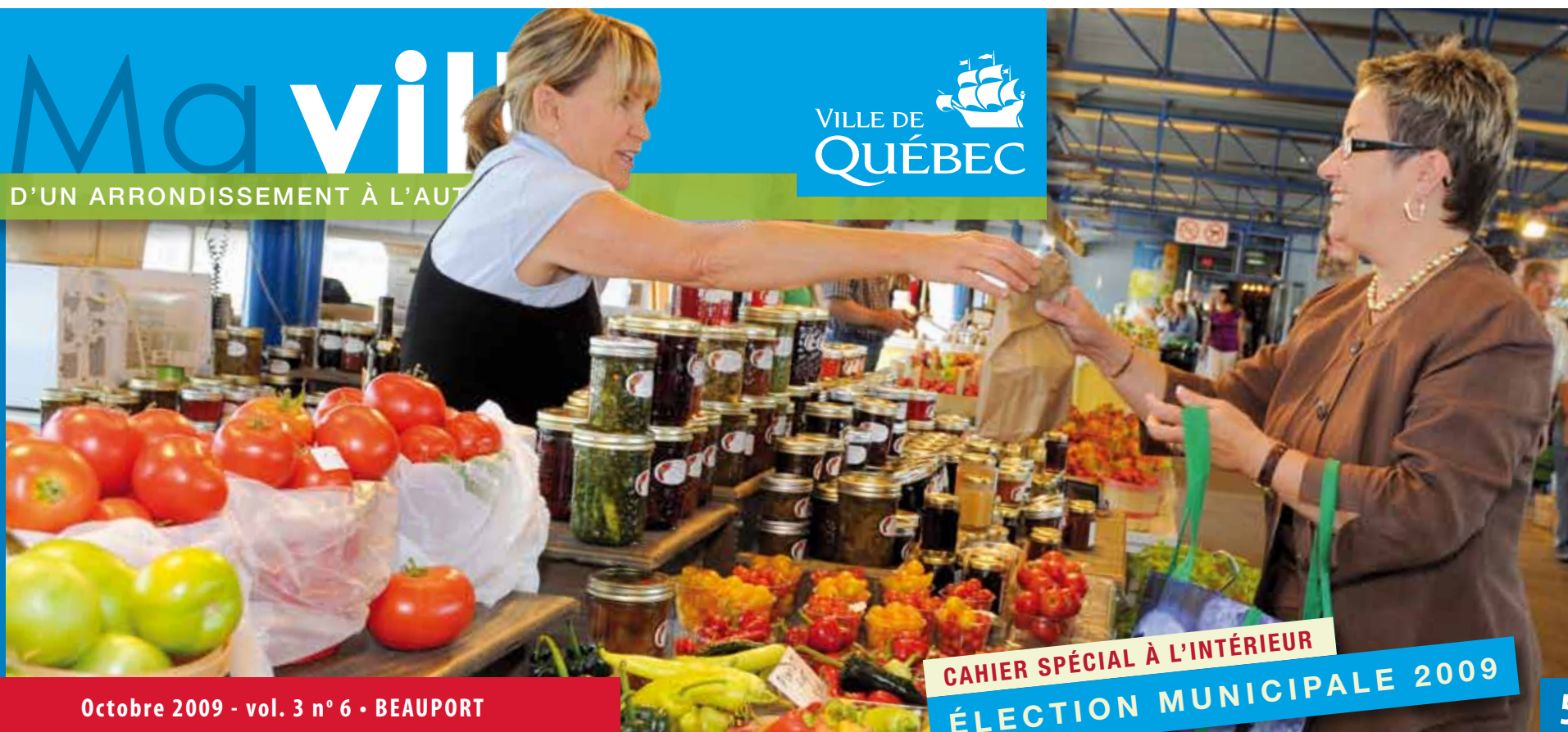
Photo : marché du Vieux-Port de Québec