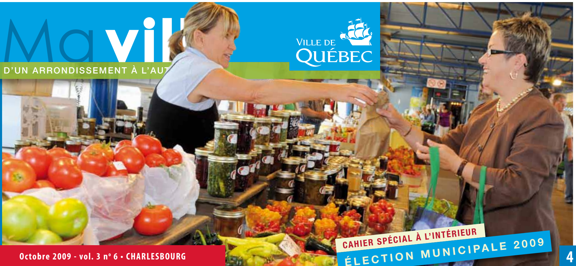
Photo : marché du Vieux-Port de Québec

Octobre 2009 - vol. 3 n° 6 - CHARLESBOURG