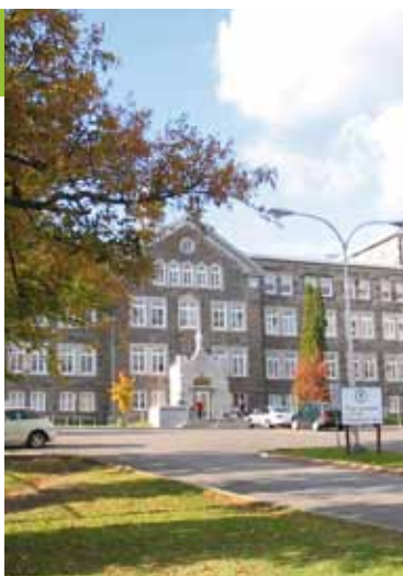
Aujourd'hui, le couvent des Sœurs de la Charité accueille, notamment la bibliothèque Chrystine-Brouillet.

Une exposition pour le 100 e anniversaire de la construction du couvent des Sœurs de la Charité de Saint-Louis-de-France offerte par la Société d'histoire de La Haute-Saint-Charles : les 26 et 27 septembre, de 10 h 30 à 15 h, au 4 e étage du Centre Saint-Louis (264, rue Racine).