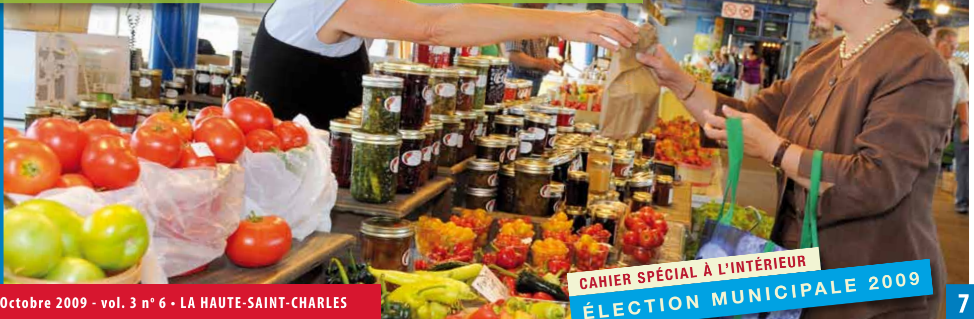
Photo : marché du Vieux-Port de Québec

CAHIER SPÉCIAL À L'INTÉRIEUR ÉLECTION MUNICIPALE 2009