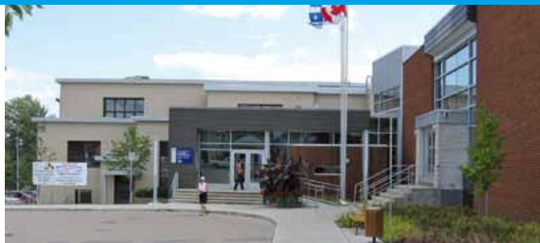
L'édifice du 305, rue Racine va demeurer le bureau d'arrondissement du nouvel Arrondissement.

Pour communiquer avec votre nouvel Arrondissement, le bureau d'arrondissement va demeurer votre porte d'entrée. Vous pourrez conti-