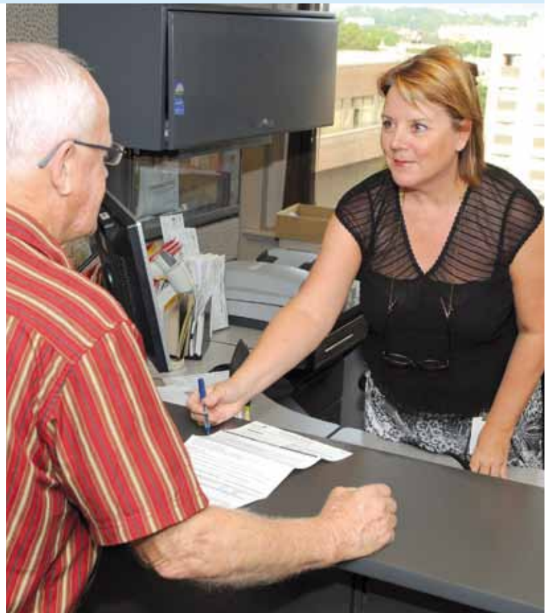
Le 1 er novembre prochain, le découpage territorial changera, mais la qualité des services à la population demeurera la même.

Ce nouveau découpage territorial a été élaboré selon les exigences de la Loi sur les élections et les référendums dans les municipalités ainsi que de celles de la Loi modifiant la Charte de la Ville de Québec adoptée en juin 2008 par le gouvernement.