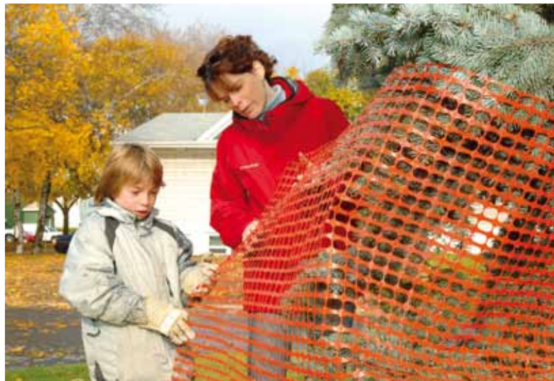
En prévision de l'hiver, procurez-vous le dépliant Protection hivernale : laissez-nous vous donner quelques conseils .

Le guide sur la protection des végétaux est disponible à l'hôtel de ville, dans les bureaux d'arrondissement et leurs points de service. Vous pouvez aussi en prendre connaissance sur le site Internet www.ville.quebec.qc.ca , rubrique Citoyens / Propriété .