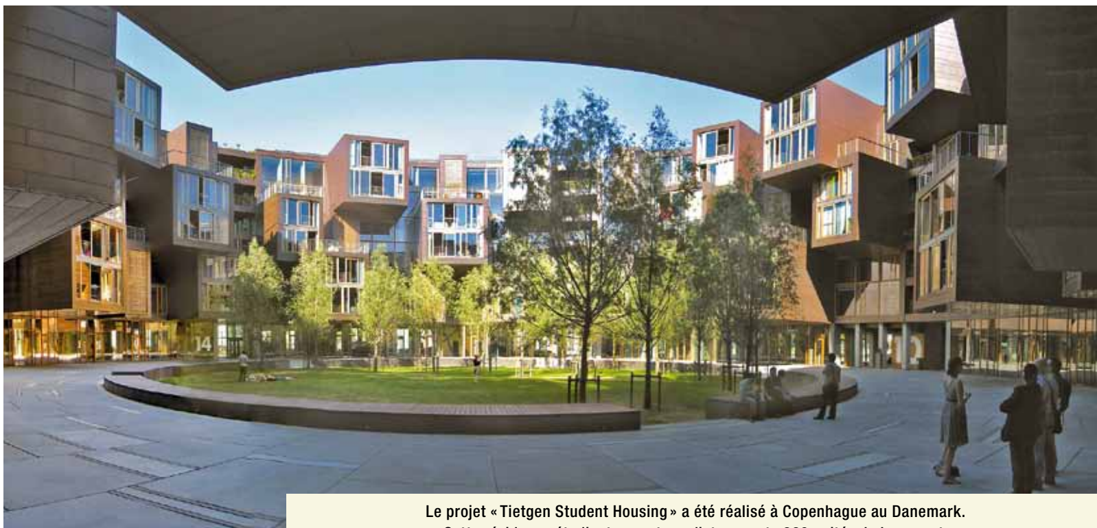
Le projet « Tietgen Student Housing » a été réalisé à Copenhague au Danemark. Cette résidence étudiante avant-gardiste compte 360 unités de logement.

Que l'on soit amateur d'architecture ou non, les bâtiments originaux et innovateurs suscitent inévitablement notre curiosité.