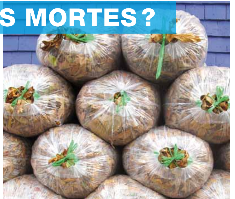
Les résidus verts collectés seront transportés vers un site de compostage.

Vous devez déposer les résidus verts dans des sacs de plastique étanches de grande capacité, transparents ou orangés, que vous placez en bordure de la chaussée avant 7 h le matin de la collecte. Les sacs contenant les résidus verts doivent être séparés des sacs d'ordures ménagères et bien attachés de sorte qu'ils soient facilement manipulables.