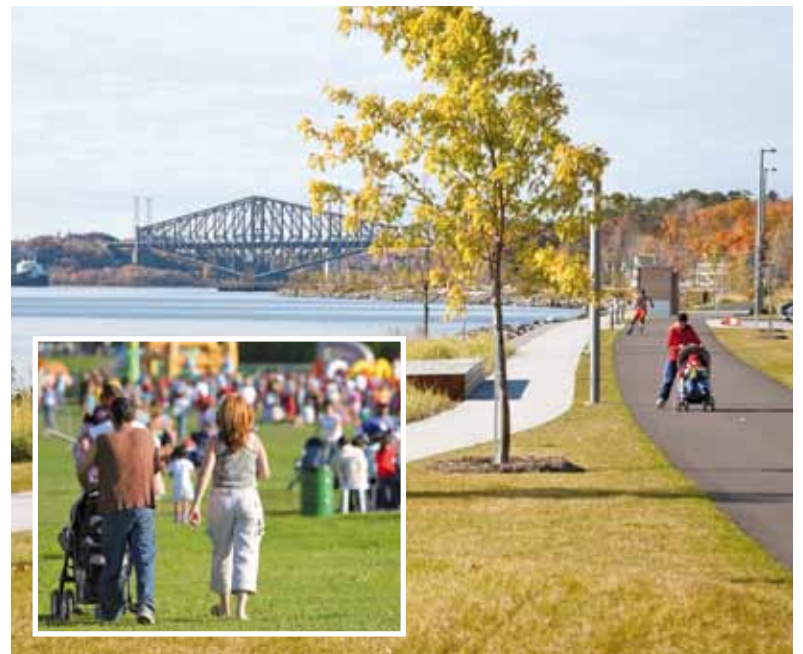
Le samedi 3 octobre, petits et grands sont invités à venir s'amuser sur le site enchanteur de la promenade Samuel-De Champlain.

L'événement sera remis au lendemain en cas de pluie. Renseignements : 418 684-2211 ou consultez le www.journeegeneractions.com .