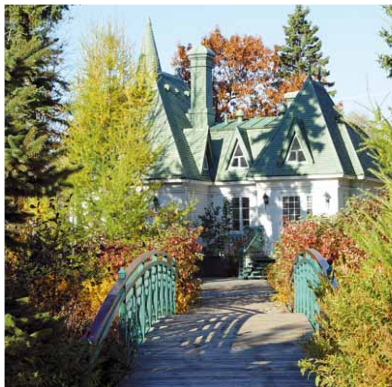
L'ancien domaine Spencer Wood, aujourd'hui devenu le parc du Bois-de-Coulange, offre aux promeneurs de pittoresques sentiers chargés d'histoire.

Intéressé à en savoir plus? Procurez-vous le Guide de randonnées pédestres de l'arrondissement historique de Sillery , au bureau d'arrondissement de Sainte-Foy-Sillery, ou sur le www.ville.quebec.qc.ca , sous l'onglet Publication/Arrondissements . Bonne randonnée!