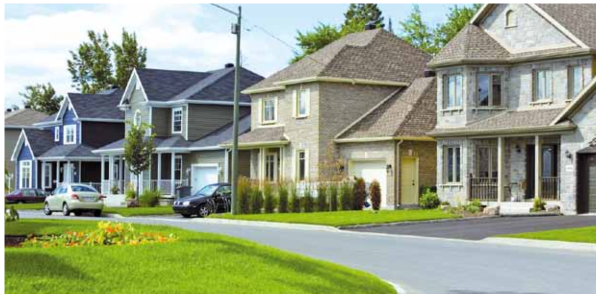
Tous les contribuables recevront d'ici la fin du mois de septembre un avis d'évaluation les informant de la nouvelle valeur de leur propriété.

Le parc immobilier de l'agglomération compte désormais plus de 166 000 unités d'évaluation. Leur