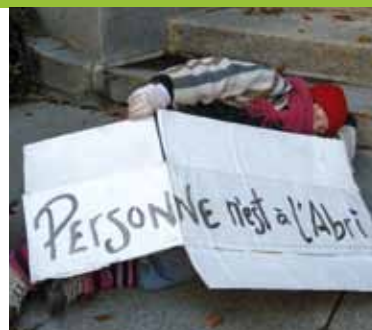
L'itinérance, une réalité souvent ignorée de plusieurs.

Pour l'occasion, les citoyens sont cordialement invités à faire un don