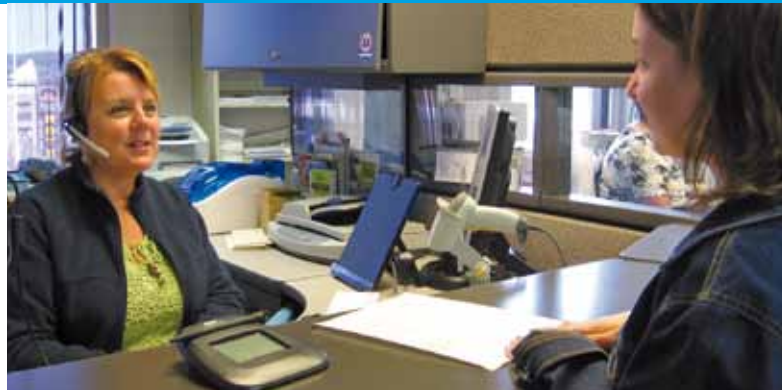
Votre nouvel Arrondissement continuera à offrir des services de qualité.

Les districts électoraux seront redéfinis afin de correspondre à la