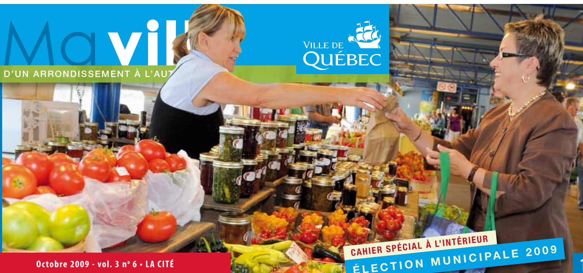
Photo : marché du Vieux-Port de Québec