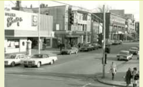
Avenue Cartier, angle René-Lévesque en 1980

Dans le cadre des Journées de la culture les 26 et 27 septembre, de 10 h à 16 h , Espace Cartier présente une exposition de photos d'époque relatant l'origine, l'histoire et le développement du quartier Montcalm