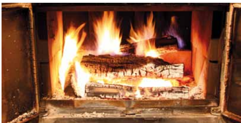
L'utilisation du chauffage au bois comme mode de chauffage principal est à éviter.

Si l'achat ou le remplacement d'un poêle ou d'un foyer est envisagé, optez pour un appareil à l'électricité (certains modèles peuvent être installés à même les appareils existants), ou encore pour un modèle au gaz ou aux granules, moins polluants que le bois. Sinon, achetez un poêle ou un foyer au bois certifié conforme aux normes canadiennes (ACNOR) ou américaines (USEPA) qui polluera jusqu'à 80 % de moins qu'un appareil non certifié.