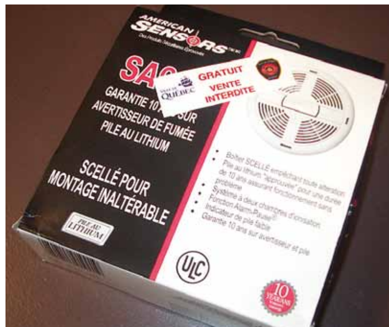
Les propriétaires visés par ce programme peuvent se procurer gratuitement des avertisseurs de fumée.

Pour obtenir de plus amples renseignements sur ce programme, composez le 418 641-6232. Vous pouvez aussi consulter le site Internet www.ville.quebec.qc.ca , module Citoyens , section Protection publique , onglet Protection contre l'incendie .