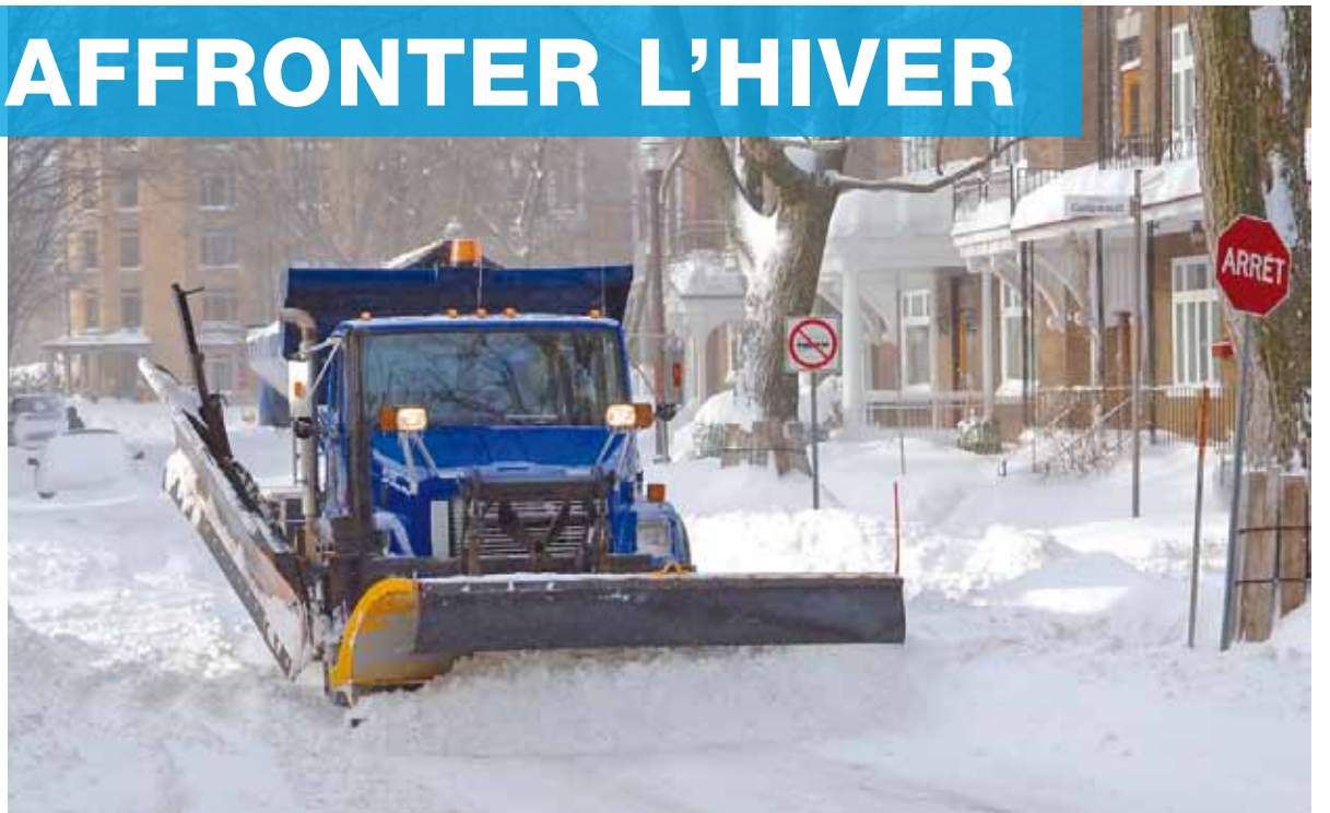
Lors des opérations d'entretien de la chaussée, le stationnement dans la rue est interdit. Soyez vigilant!

✳ Les clignotants orange - Dans l'arrondissement de La Cité-Limoilou , des feux clignotants sont mis en fonction au moins trois heures avant l'entrée en vigueur d'une interdiction de stationner dans les rues, soit au plus