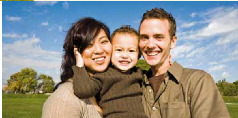
L'immigration aide à contrer la dénatalité et le vieillissement de la population.

Source : Statistique Canada – Recensement 2006 Analyse et traitement : Commissariat aux relations internationales et à l'immigration de la Ville de Québec