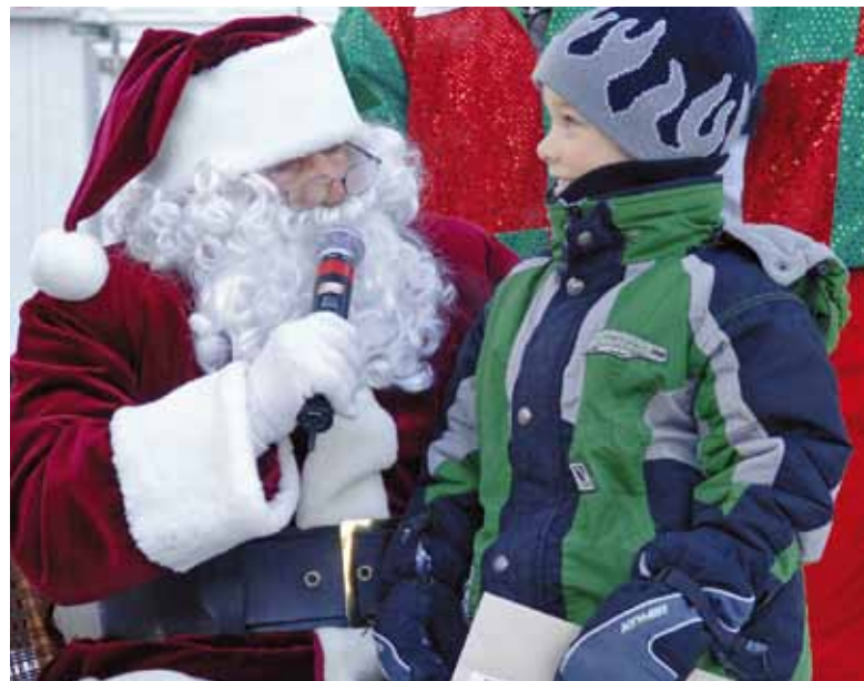
Le père Noël rendra visite aux petits et grands le 6 décembre à la place D'Youville.

Plusieurs autres activités sont au programme de cette journée festive : spectacle de Noël, séance photo avec le père Noël et tirage d'un forfait familial offert par ExpoCité pour le spectacle Alegria du Cirque du Soleil . L'activité est gratuite. Renseignements : 418 641-6325.