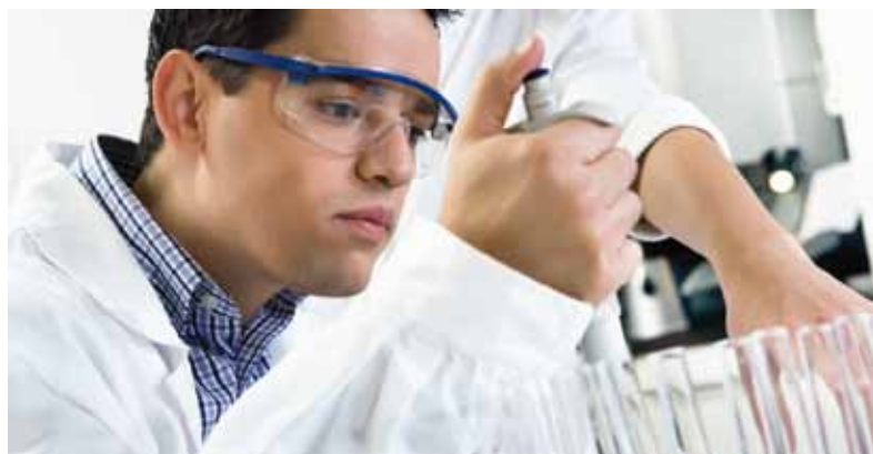
Les immigrants sont plus scolarisés que la moyenne de la population de Québec.