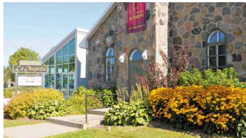
Le centre d'art La Chapelle vient tout juste de lancer sa programmation hivernale.

Pour obtenir plus de renseignements : 418 686-5032 ou www.centredartlachapelle.com .