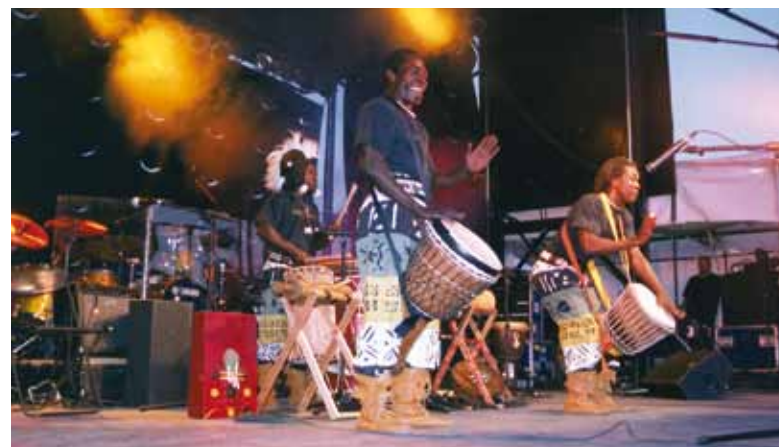
La mise en valeur de cultures différentes favorise l'ouverture et le rapprochement.

Le Conseil interculturel de la Ville de Québec (CIQ), créé en 2002, accompagne et conseille la Ville dans ses orientations et ses actions favorisant l'intégration et la gestion de la diversité culturelle. Quinze personnes de toutes provenances siègent au CIQ. Deux élus sont membres observateurs. Vous pouvez joindre les membres du CIQ au 418 641-6777 ou au conseilinterculturel@ville.quebec.qc.ca .