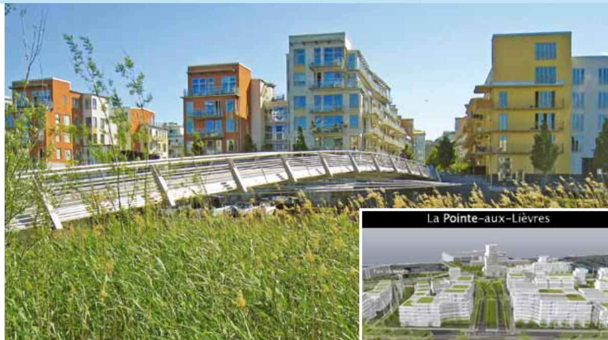
Le quartier Hammarby Sjöstad, à Stockholm, constitue l'une des références européennes en matière d'écoquartier. La Ville veut s'en inspirer pour le développement du secteur de la Pointe-aux-Lièvres.

De véritables milieux de vie seront ainsi créés, inspirés par ce qu'il se