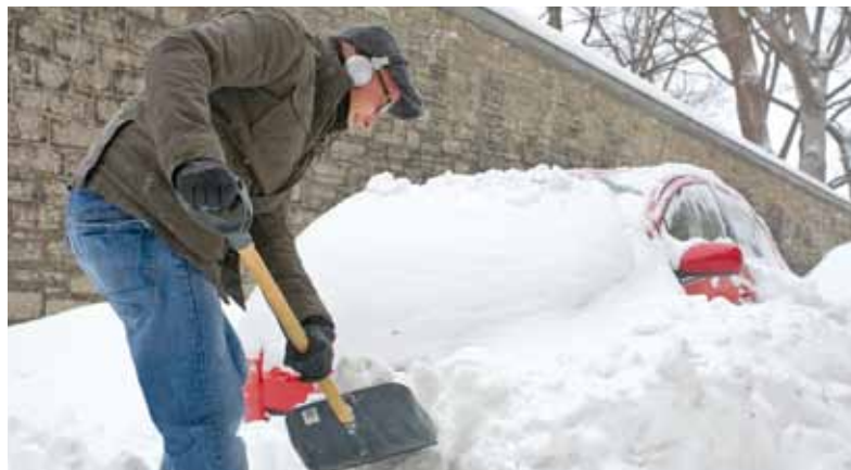
Il est temps de se procurer son permis de déneigement pour la saison 2009-2010.

Renseignements : communiquez avec votre arrondissement ou consultez le site Internet de la Ville, au www.ville.quebec.qc.ca .