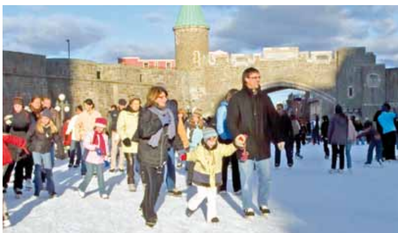
Patinoire de la place D'Youville.

Pour obtenir plus de renseignements sur les horaires, consultez le site Internet de la Ville de Québec, www.ville.quebec.qc.ca , section Citoyens / Loisirs et sports . Une belle façon de bouger et de faire de l'activité physique!