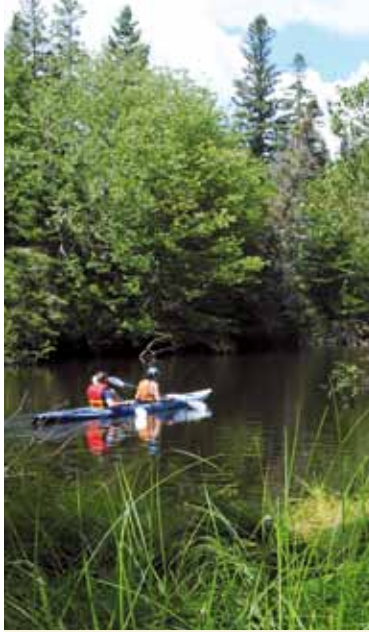
Le Règlement sur les nuisances, nouvellement harmonisé, protégera davantage la végétation riveraine.

Le Règlement sur les nuisances a été harmonisé et la section « neige » contribue entre autres à mieux protéger la végétation des écosystèmes riverains. En effet, les résidents et les propriétaires riverains ne peuvent désormais plus pelleter ou « souffler » de la neige à moins de 10 mètres de l'eau. C'est une façon simple de préserver les rives et donc, l'équilibre de nos cours d'eau. À bien y penser, tout le monde y gagne!