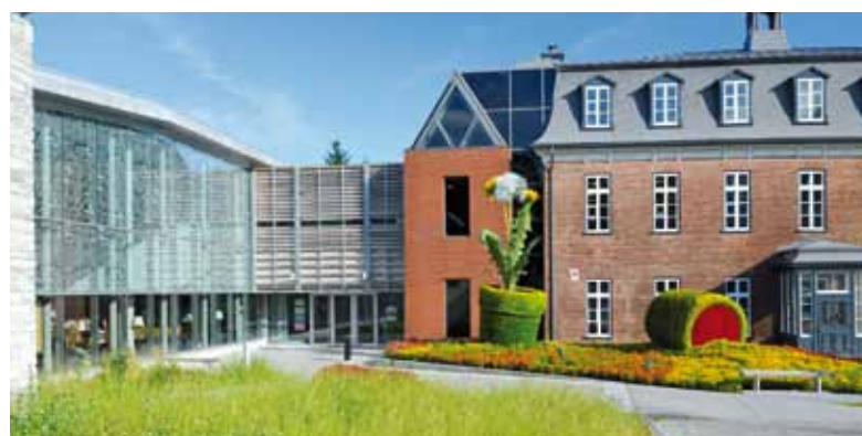
La bibliothèque de Charlesbourg a remporté le prix du public en 2008.