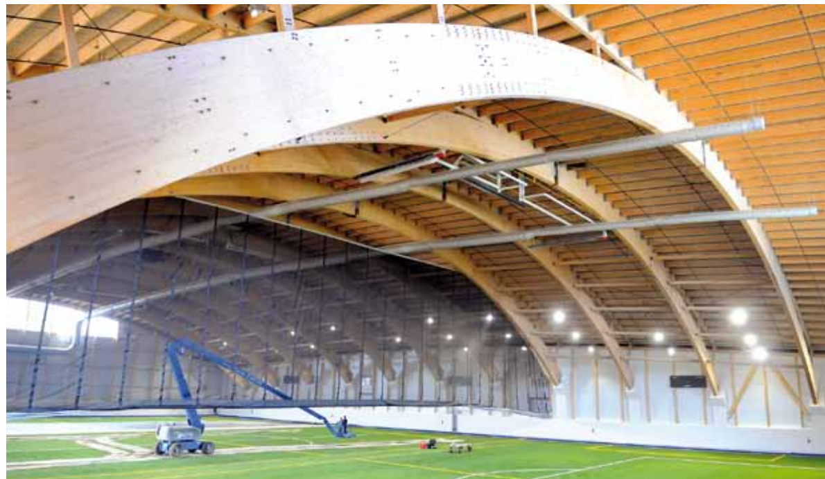
L'architecture du nouveau complexe de soccer intérieur fait tourner bien des têtes : sa charpente intérieure est entièrement faite de bois. C'est le deuxième du genre au Québec.

Au cours des trois dernières années, la Ville a investi un peu plus de 19 millions $ afin de se doter