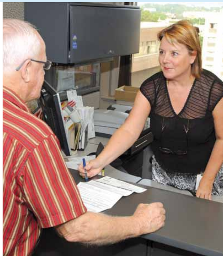
Le 1 er novembre prochain, le découpage territorial changera, mais la qualité des services à la population demeurera la même.

Ce nouveau découpage territorial a été élaboré selon les exigences de la Loi sur les élections et les référendums dans les municipalités ainsi que de celles de la Loi modifiant la Charte de la Ville de Québec adoptée en juin 2008 par le gouvernement.