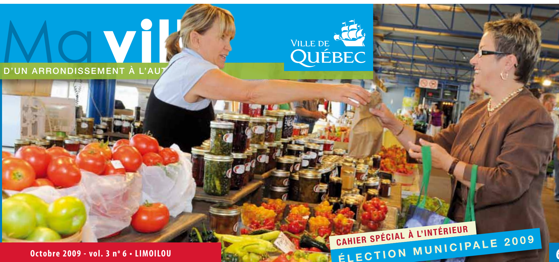
Photo : marché du Vieux-Port de Québec