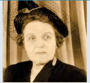
Irma Lavasseur - Gracieuseté de l'Hôpital de l'Enfant-Jésus du CHA.

Rappelons qu'Irma Lavasseur fut la première femme médecin au Québec. Impressionnée par le taux de mortalité infantile, elle étudie la pédiatrie à Paris, puis fait des recherches dans des hôpitaux en Allemagne. De retour au Québec, elle contribue à la création de l'hôpital Sainte-Justine de Montréal. Avec ses propres économies, elle met en place un dispensaire avec deux collè-