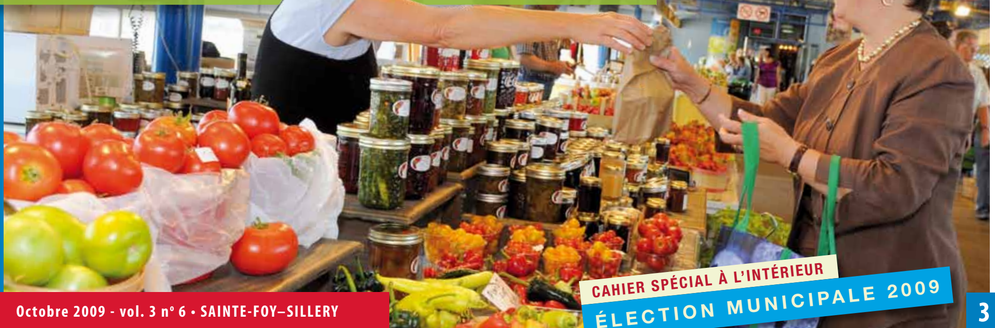
Photo : marché du Vieux-Port de Québec

Octobre 2009 - vol. 3 n° 6 • SAINTE-FOY-SILLERY