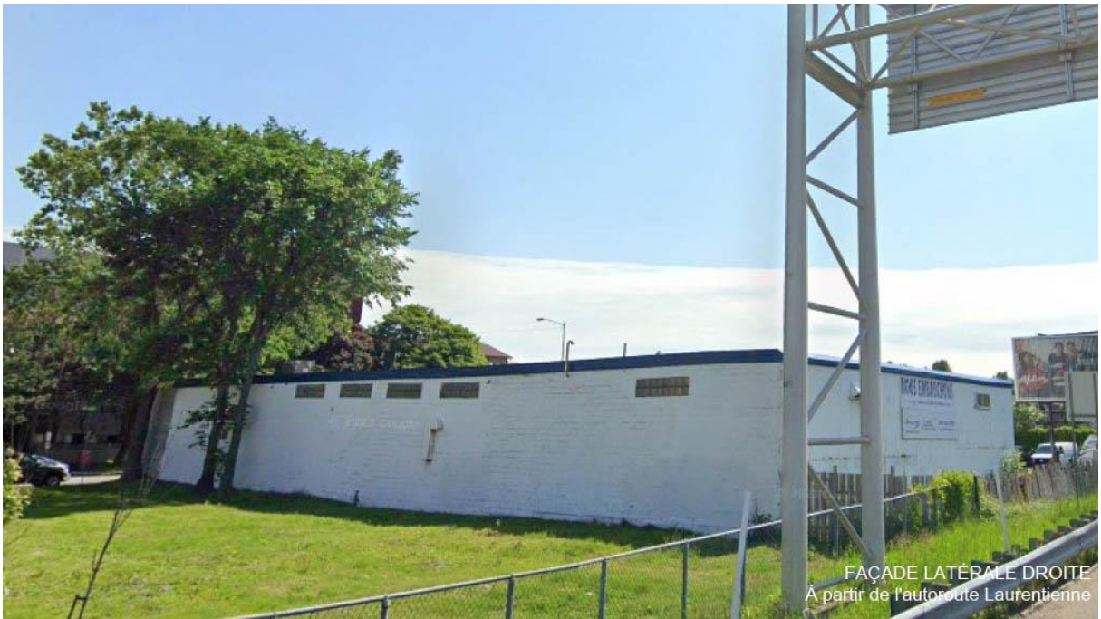
FAÇADE LATÉRALE DROITE À partir de l'autoroute Laurentienne