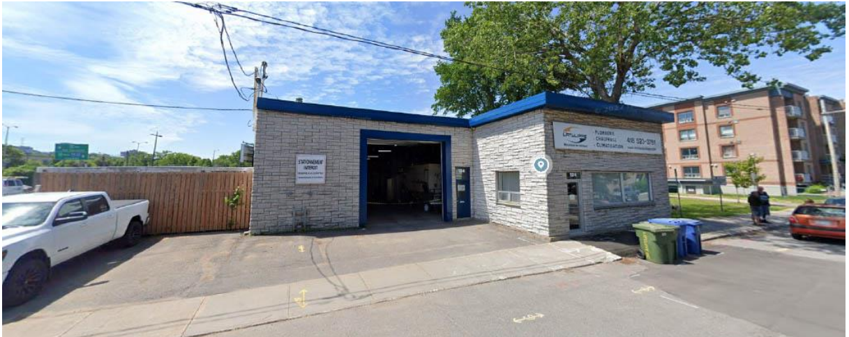
FAÇADE AVANT Rue de la Pointe-aux-Lièvres