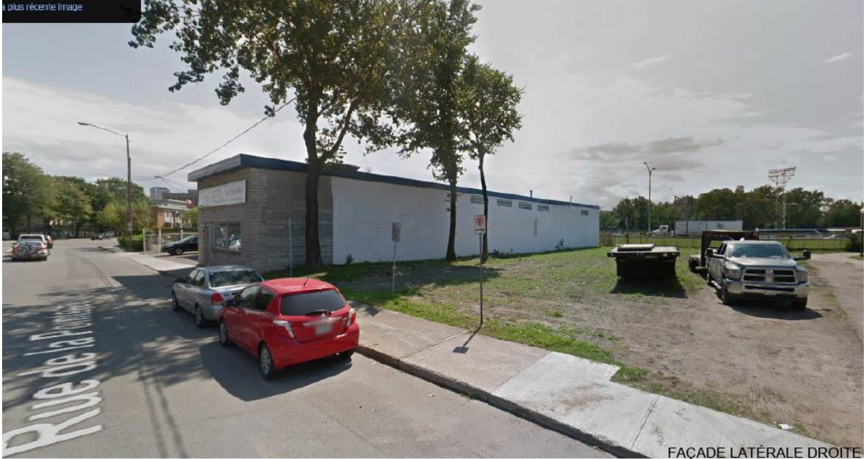
FAÇADE LATÉRALE DROITE À partir de la rue de la Pointe-aux-Lièvres