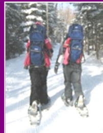
Boucle de ¾ km