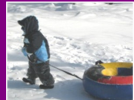
3 descentes en chambre à air