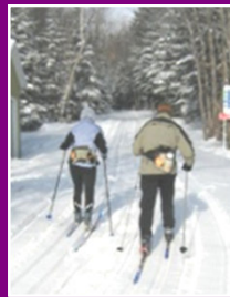
Faire la piste n° 1