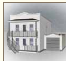
Ajout d'un garage dont le toit reprend la forme et l'ornementation de la toiture de la maison.

L'ajout d'éléments d'ornementation de styles plus anciens et incompatibles avec l'architecture des plex et des maisons boomtown est à éviter.