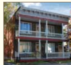
La corniche ouvragée du 125-127, avenue Proulx est un bon exemple d'un traitement compatible avec l'âge et le style architectural de la maison.

Lorsque le toit de la maison se prolonge au-dessus de la galerie, il est préférable de l'agrémenter d'une corniche ouvragée.