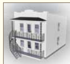
Toit de galerie à trois versants

Le toit en pente à trois versants est la forme de toit appropriée pour couvrir une galerie.