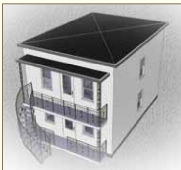
LE TOIT À BASSIN ou à avaloir central

LE PLEX typique que l'on retrouve dans le Vieux-Vanier est une maison à deux étages abritant de deux à quatre logements, chacun doté d'une entrée indépendante, avec un escalier tournant en façade. Le plex typique a une forme cubique simple et est surmonté d'un toit plat généralement à bassin (avaloir ou drain central).