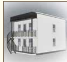
Toit en forme de boîte surmontant la galerie.

Le petit toit en forme de boîte surmontant la galerie ou le balcon est également inesthétique et est à éviter.