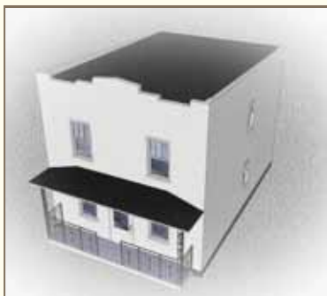
LE TOIT MONOPENTE ou toit à un seul versant à pente très faible vers l'arrière

LA MAISON BOOMTOWN typique que l'on retrouve dans le Vieux-Vanier est une maison unifamiliale à deux étages, avec entrée de plain-pied (deux ou trois marches) et perron couvert. Ancêtre du plex, elle a une forme cubique simple et est surmontée d'un toit plat généralement monopente (un seul versant à pente très faible vers l'arrière).