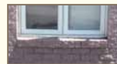
Brique de béton rose, appui de briques en boutisse à éviter.

LE BÉTON BRUT OU DE COULEUR FANTAISISTE (rose, bleue, noire, etc.) est déconseillé dans le Vieux-Vanier. Il est préférable de choisir des couleurs et des formats qui imitent ceux de la brique d'argile ou de la pierre naturelle.