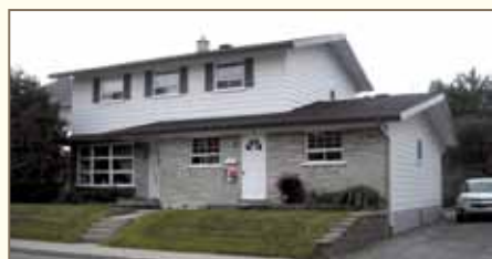
Le 428-430 de la rue Chabot, offre un bon exemple de combinaison d'un parement de maçonnerie et d'un revêtement léger.

En général, il est préférable de s'en tenir à un maximum de trois matériaux de revêtement en s'assurant que la composition de l'ensemble soit harmonieuse.