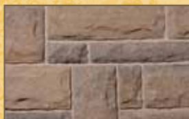
Appareil de pierre à assises régulières