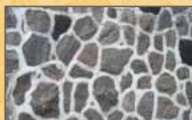
Appareil de pierre à assises irrégulières