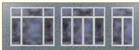
Exemple de fenêtres avec imposte

FENÊTRE À BATTANTS (typique des maisons à combles habitables et des maisons à deux étages) : fenêtre surmontée d'une imposte lorsque l'ouverture a environ 150 centimètres (5 pieds) de hauteur et plus; fenêtre à un seul battant lorsque l'ouverture a moins d'environ 60 centimètres (2 pieds) de largeur.