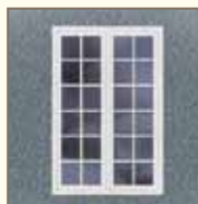
Imitation de fenêtre ancienne par insertion de croisillons dans le vitrage thermique