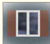
Imitation de volets anciens

Avant d'entreprendre des travaux de rénovation ou de construction, informez-vous auprès de votre arrondissement afin de vous assurer que votre projet respecte la réglementation en vigueur.