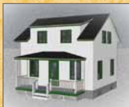
Exemple en vert