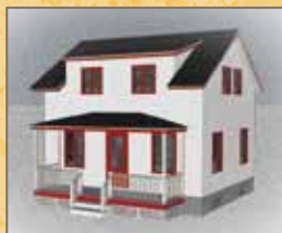
Exemple en rouge

L'utilisation de portes et de fenêtres de couleur est un moyen de personnaliser un bâtiment en lui donnant du cachet. Il est conseillé d'employer une même couleur pour l'ensemble des portes et des fenêtres. S'il y a des moulures décoratives autour des ouvertures, celles-ci peuvent être peintes d'une couleur identique ou contrastante par rapport à celle du cadre.