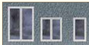
Exemple de fenêtres sans imposte

FENÊTRE À GUILLOTINE (typique des maisons boomtown et des plex) : fenêtre avec ou sans meneaux sur le châssis du haut; fenêtres jumelées dans les grandes ouvertures. L'ouverture est proportionnée selon un rapport largeur/hauteur de 3 sur 5; par exemple, pour une largeur de 90 centimètres (3 pieds), la hauteur sera de 150 centimètres (5 pieds).