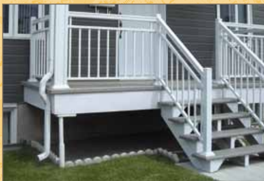
Exemple d'un bon modèle de garde-corps réalisé d'un matériau de substitution.

Nombre de galeries et d'escaliers du Vieux-Québec sont réalisés de matériaux de substitution plus contemporains, mais dont le profil et le mode d'assemblage imitent ceux des composantes traditionnelles. C'est le cas de l'acier galvanisé (imitant le fer forgé), de l'aluminium et du PVC (imitant le fer forgé ou le bois).