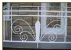
Exemple de garde-corps surhaussé avec des traverses supérieures.

Lorsque la galerie du rez-de-chaussée se trouve à une hauteur de plus de 60 centimètres (2 pieds), l'espace du dessous peut être fermé par un treillis encadré.