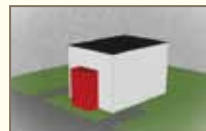
Ajout de corps secondaire inappropriée • ajout en façade sur rue