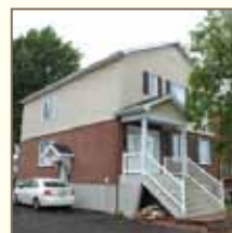
Lorsque les murets de soutènement sont inévitables, il est recommandé de les dissimuler par un couvert végétal (arbustes, plantes grimpantes, etc.)

Avant d'entreprendre des travaux de rénovation ou de construction, informez-vous auprès de votre arrondissement afin de vous assurer que votre projet respecte la réglementation en vigueur.