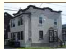
Ajout arrière approprié