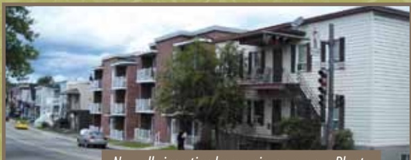
Nouvelle insertion harmonieuse, avenue Plante