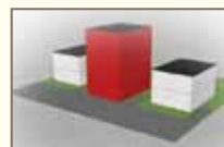
Nouvelle construction inappropriée • trop près de la rue • trop haute