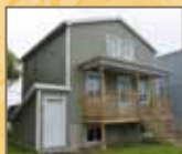
Exhaussements de sous-sol appropriés