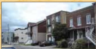
Nouvelle insertion, avenue Plante, lorsque le niveau de rez-de-chaussée est élevé, il est recommandé de dissimuler les murs de béton par un couvert végétal (arbustes, plantes grimpantes, etc.)

NOUVELLE CONSTRUCTION : pour une insertion harmonieuse, la hauteur d'une nouvelle construction devrait tenir compte de la hauteur moyenne des maisons voisines. De plus, le niveau du rez-de-chaussée de la nouvelle construction devrait correspondre à celui des rez-de-chaussée généralement observés sur les maisons voisines (généralement de plein-pied).