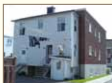
Ajout arrière approprié