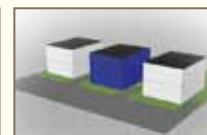
Nouvelle construction appropriée • alignement respecté • même gabarit