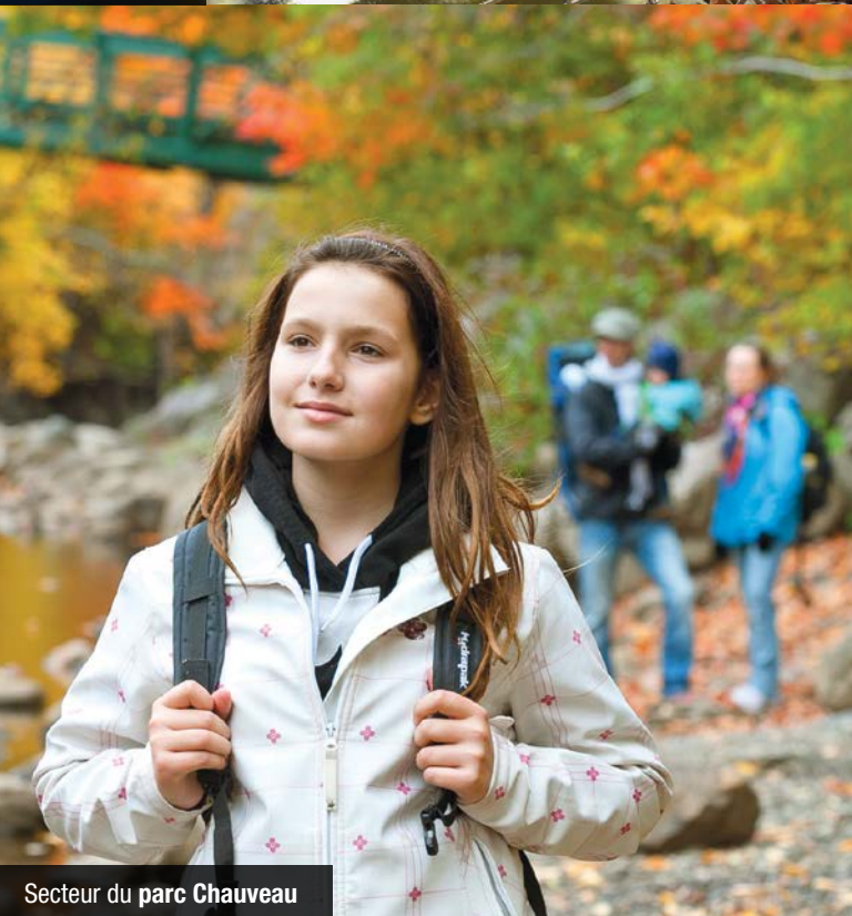
Secteur du parc Chauveau