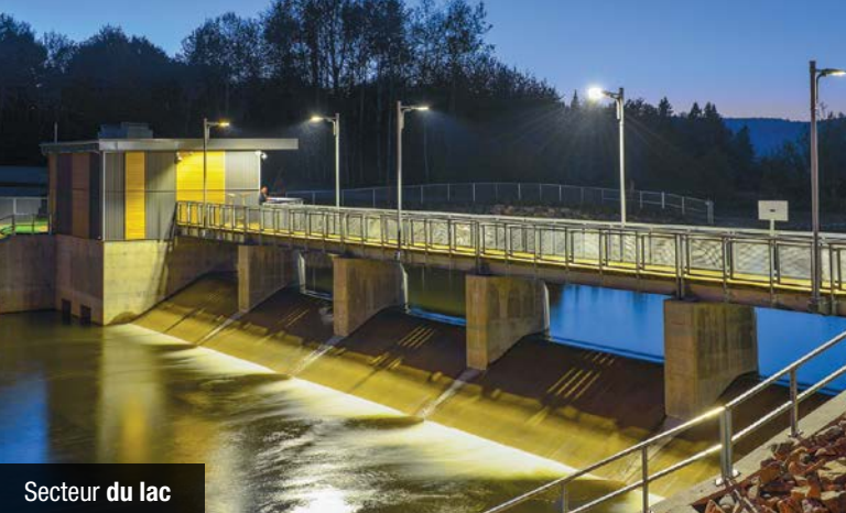
Secteur du lac