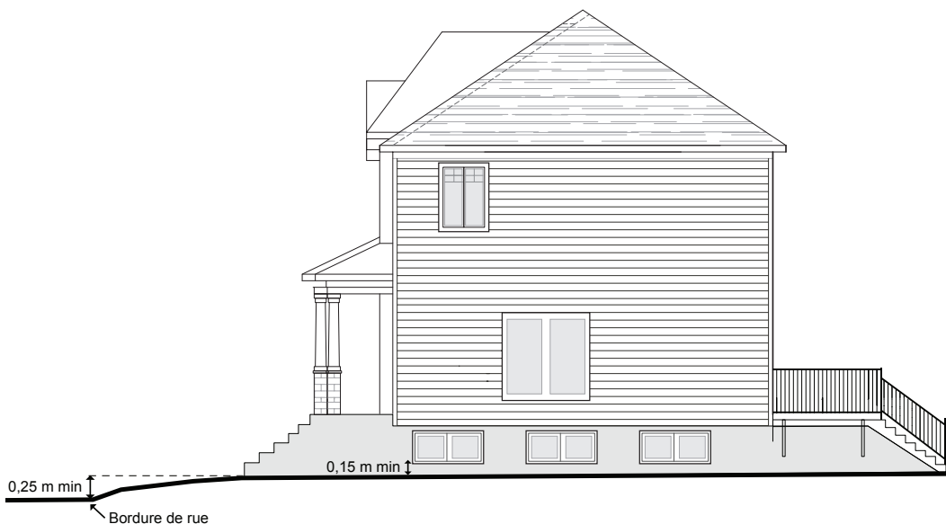
CROQUIS 3 – NIVELLEMENT DE TERRAIN