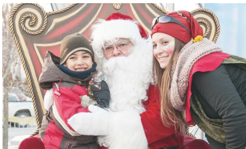
Le 10 décembre dernier, l'activité L'avenue Royale fête Noël a mis des sourires sur le visage des petits et des grands.

Plus de 2000 personnes se sont déplacées sur les cinq sites animés. Cette activité d'envergure a été rendue possible grâce à la participation des regroupements de loisirs et des marchands du secteur.