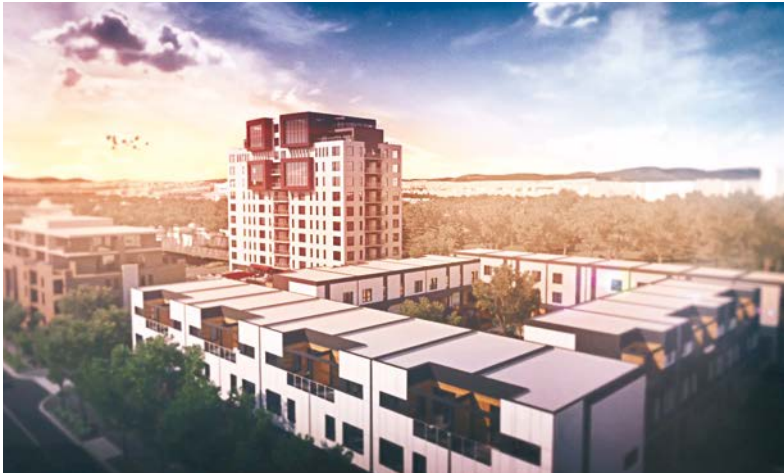
Plan-image de l'écoquartier de la Pointe-aux-Lièvres

L'écoquartier de la Pointe-aux-Lièvres offrira un milieu de vie dynamique et idéal pour tous les types de ménages.