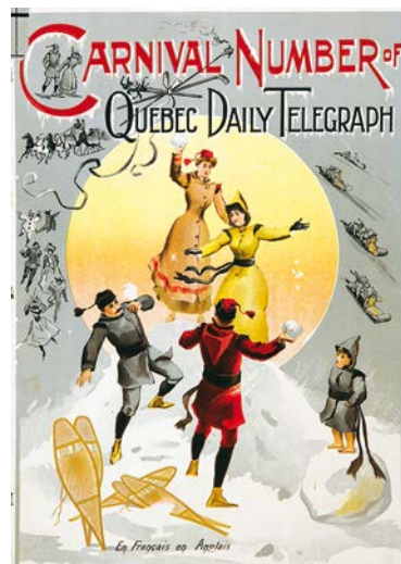
« Carnaval : Numéro spécial du Quebec Daily Telegraph (gravure) », 1894 (AVQ, CT-9-981-05)

Pour découvrir les Archives en ligne et suivre le blogue, visitez le www.ville.quebec.qc.ca/archives .