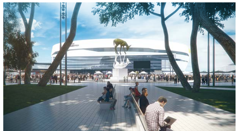
Aménagement de la place publique Jean-Béliveau pour 8 M$ sur un projet totalisant 10 M$