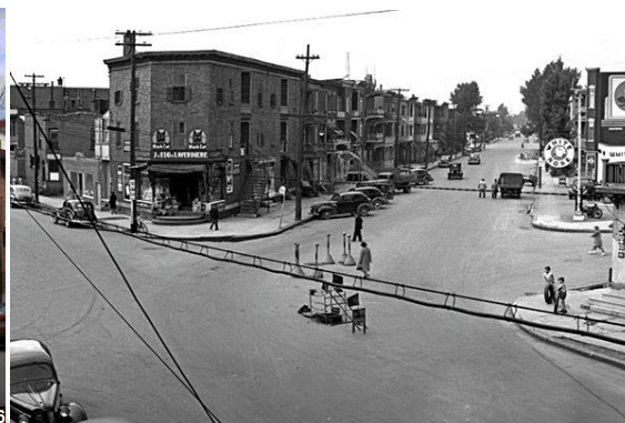
Intersection 3e avenue et chemin de la canardière (1946)

Le conseil de quartier Vieux-Limoilou souhaite partager son avis sur la question 8 du document de mise en contexte de la Ville portant sur la participation citoyenne, l'accessibilité du patrimoine, les initiatives et la concertation :