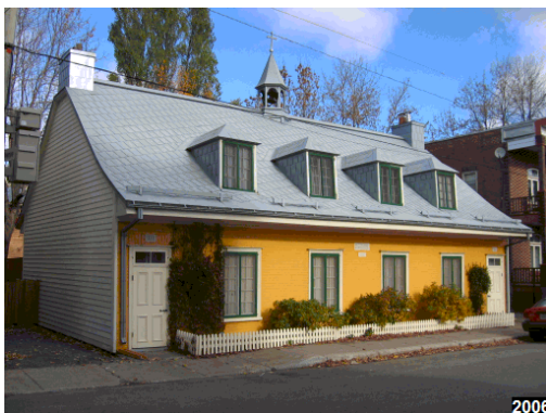
École Saint-Charles-de-Hedleyville (circa 1863)

Mémoire du conseil de quartier Vieux-Limoilou (Québec) Juillet 2016