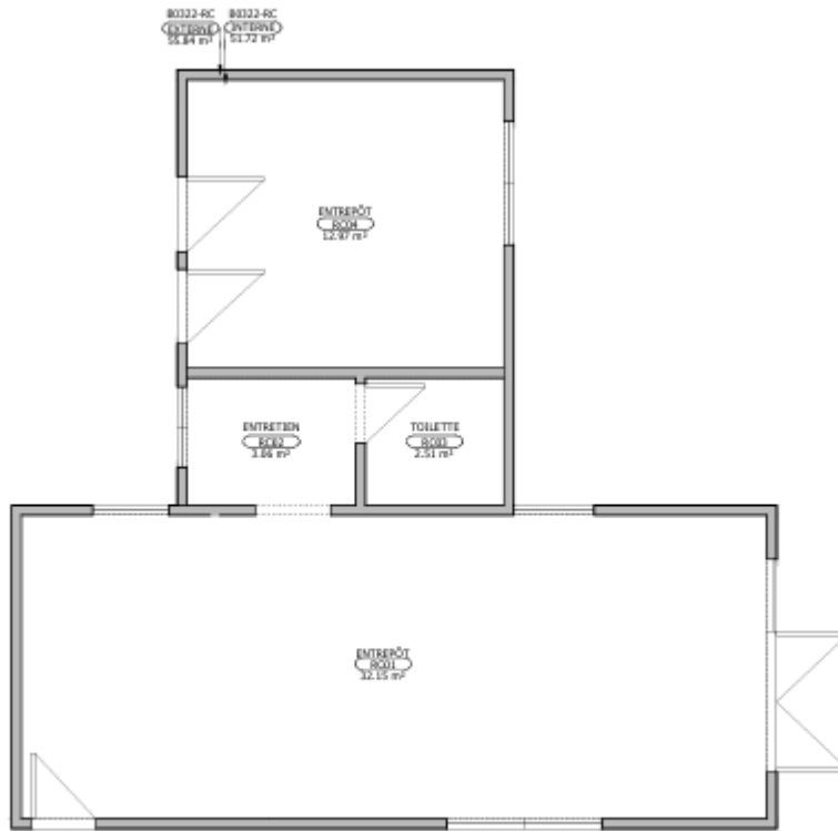
PLAN DU REZ-DE-CHAUSSÉE Echelle : 1/50