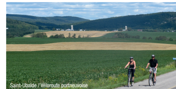
Saint-Ubalde / Véloroute portneuvoise