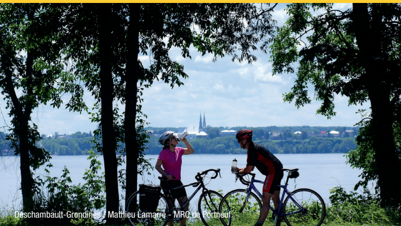
Deschambault-Grondines / Mathieu Lamarre - MRC de Portneuf

Villages – Terres agricoles (Farmland) – Agrotourisme (Agritourism) – Activités nautiques (Boating) – Randonnée pédestre (Hiking) – Fromagerie (Cheese maker) – Kiosques maraîchers (Fruit & vegetable stands) – Parc naturel régional de Portneuf – Patrimoine religieux (Religious heritage) – Moulin de La Chevrotière (Mill) – Moulin à vent de Grondines (Windmill) – Vieux presbytère de Deschambault (Former presbytery) – Quais (Wharves)