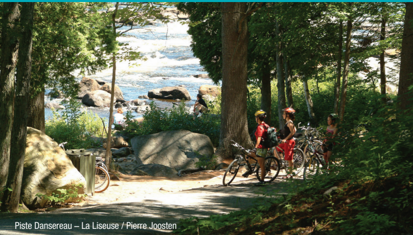
Piste Dansereau – La Liseuse / Pierre Joosten

Corridor des Cheminots – Vélopieste Jacques-Cartier / Portneuf – Piste Dansereau / La Liseuse – Chemin du Roy (King's Road) – Corridor du Littoral – Promenade Samuel-De Champlain – Fleuve Saint-Laurent (St. Lawrence River) – Patrimoine architectural et religieux (Architectural and religious heritage) – Wendake / Nation huronne-wendat (Wendake / Huron-Wendat Nation) – Domaine de Maizerets – Microbrasserie (Microbrewery) – Vignoble (Vineyard) – Galerie d'art (Art gallery) – Tour d'observation (Lookout tower)