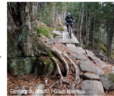
Sentiers du Moulin / Gilles Morneau