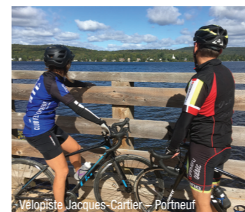
Vélopediste Jacques-Cartier – Portneuf

1 Les Chalets Alpins ★★ à ★★★★★ 369, chemin du Hibou Stoneham-et-Tewkesbury G3C 1S3 418-848-4888 / 1-866-882-4888 www.chaletsalpins.ca