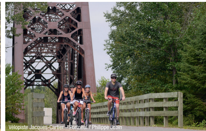
Vélopediste Jacques-Cartier – Portneuf