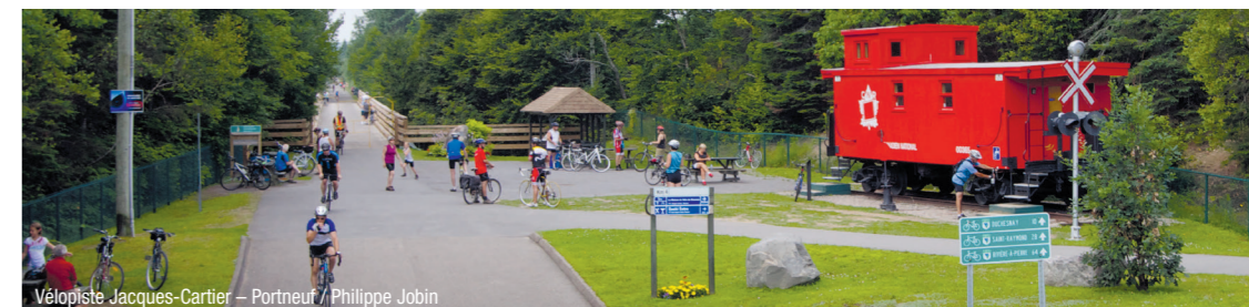
Vélopediste Jacques-Cartier – Portneuf