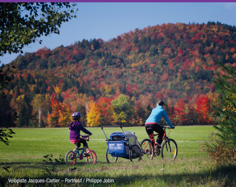
Vélopediste Jacques-Cartier – Portneuf / Philippe Jobin

Vallée Bras-du-Nord – Station touristique Duchesnay – Activités nautiques (Boating) – Randonnée pédestre (Hiking) – Fromagerie (Cheese maker) – Réserve faunique de Portneuf (Wildlife reserve) – Patrimoine religieux (Religious heritage)