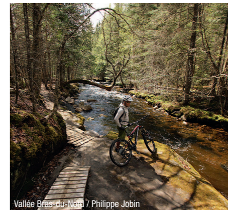
Vallée Bras-du-Nord / Philippe Jobin

4 Tourisme Portneuf 185, route 138 Cap-Santé GOA 1L0 418-285-3744 / 1-844-285-5674 www.tourisme.portneuf.com