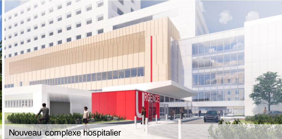
Nouveau complexe hospitalier