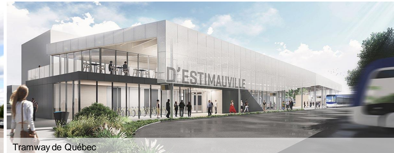
Tramway de Québec