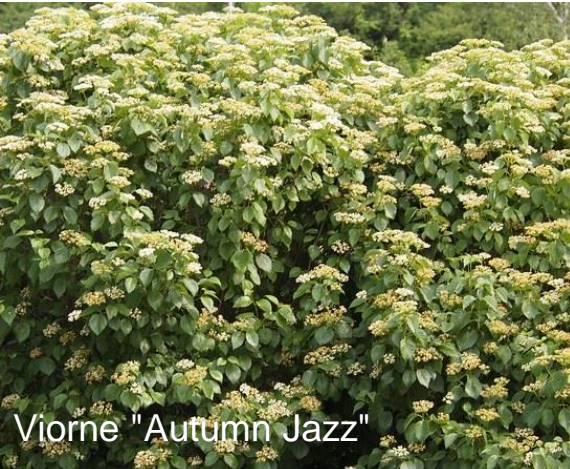
Viorne "Autumn Jazz"