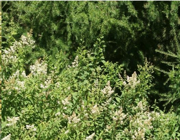
Spirée à large feuille