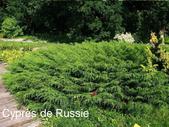
Cyprés de Russie