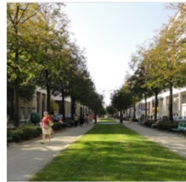
Prévoir une trame verte