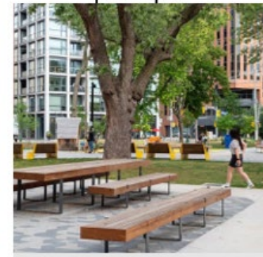
Aménager une place publique