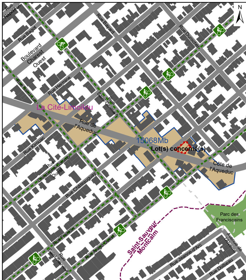
Dimension du plan : 11 cm X 12,5 cm 1/2 page