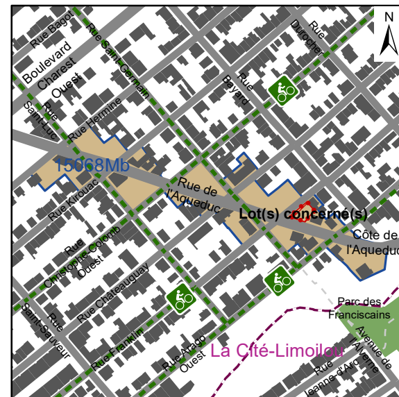
Dimension du plan : 7,5 cm X 7,5 cm 1/3 page

SERVICE DE LA PLANIFICATION DE L'AMÉNAGEMENT ET DE L'ENVIRONNEMENT