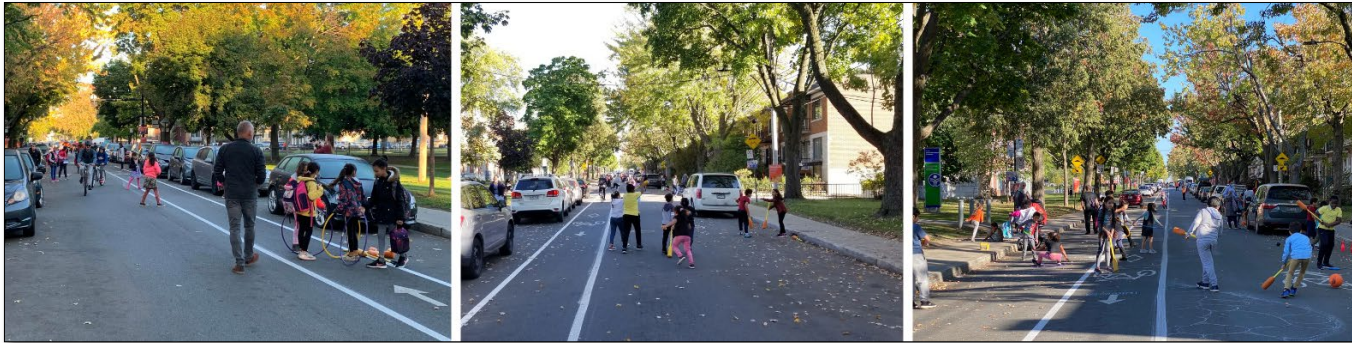
Rue-école Sainte-Bernadette-Soubirous, dans le quartier Rosemont, à Montréal

Actuellement, 10 écoles primaires de Québec ont manifesté leur intérêt pour participer au projet de rue-école. Après avoir effectué une évaluation préliminaire, il a été constaté que 7 de ces écoles rencontrent les conditions et les critères nécessaires pour l'implantation du projet (voir tableau 1).