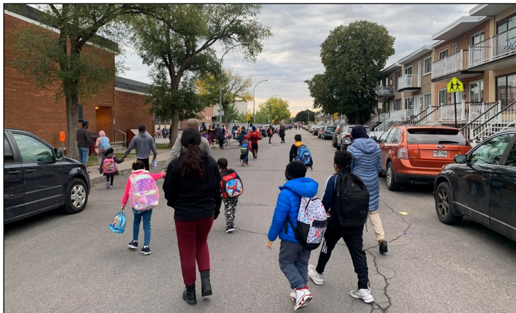
Rue-école Marie-Rivier, dans l'arrondissement de Villeray–Saint-Michel–Parc-Extension, Montréal

L'implantation de rue-école fait partie des actions complémentaires à la Stratégie de sécurité routière 2020-2024 . Cette stratégie prévoit la mise en place de cheminements scolaires sécurisés dans 115 écoles primaires du territoire.