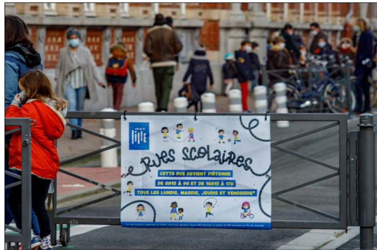
Entrée d'une rue-école à Lille, France

Après cette période, l'analyse des observations permettra de mesurer l'impact du projet sur la mobilité des enfants et leur sécurité.