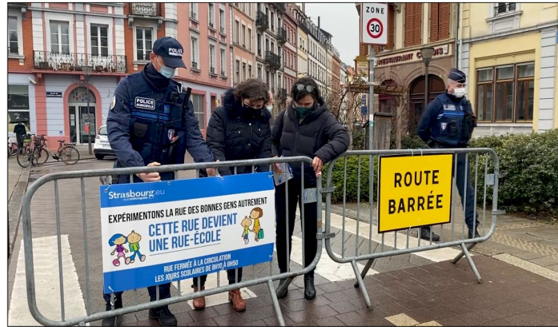
Rue-école Saint-Jean, situé dans la rue des Bonnes-Gens à Strasbourg, France

L'opération consiste à fermer la rue à la circulation automobile (sauf exception) durant la période où les enfants arrivent et repartent de l'école. Son succès s'appuie évidemment sur un processus participatif qui met à contribution la municipalité, le personnel de l'école, les enfants, les parents, et des acteurs du milieu (Centdegres.ca , 2022).