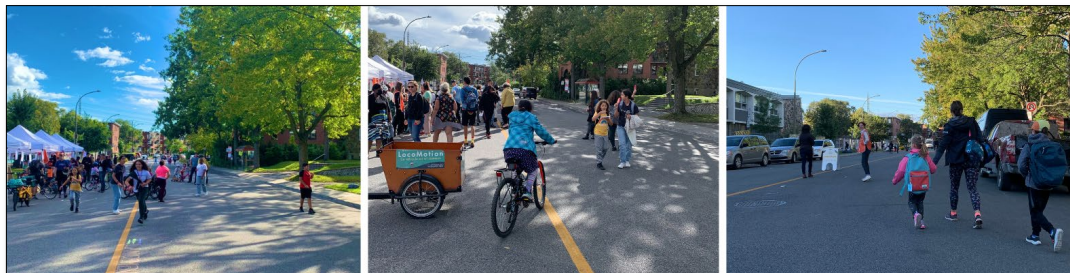
Rue-école Saint-Benoît, Montréal