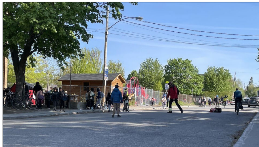
Rue-école du Lac-des-Fées, située dans le secteur de Hull, Gatineau.

Il s'agit d'une intervention limitée dans le temps, afin de créer un environnement convivial et sécuritaire qui encourage la mobilité indépendante et active des enfants ( Centdegres.ca , 2022).