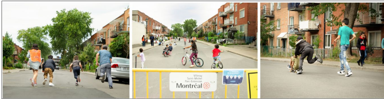
Rue ludique Birnam, situé dans le quartier Parc-Extension à Montréal

Il est important de bien différencier une rue-école et une rue ludique . La rue ludique est une rue résidentielle qui est temporairement fermée à la circulation en vue de créer un espace de jeu libre . Elle favorise l'autonomie de mouvement pour les enfants, et, en général, pour tous les habitants de la rue.