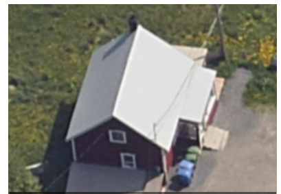
ÉLÉV. LAT. GAUCHE