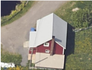
ÉLÉV. LAT. DROITE