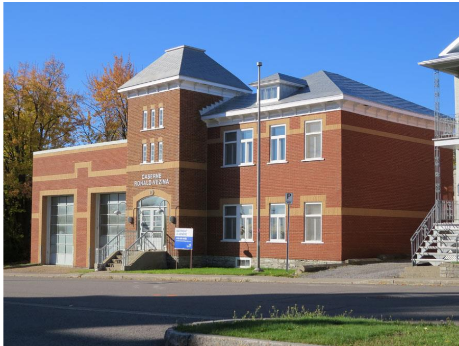
Figure 2 : ancienne caserne Ronald-Vézina (26, rue Vachon)

Considérant que nous sommes dans une zone mixte, ancien cœur de village où se retrouvent plusieurs établissements générateurs d'achalandage et que les usages souhaités permettent de maintenir l'intégrité du bâtiment, il est proposé de permettre, comme usages spécifiquement autorisés, un columbarium et une chapelle dans la zone 53107Mb.