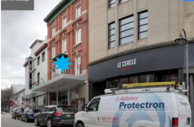
Illustration 3 : Immeuble voisin (Le Cercle), côté est