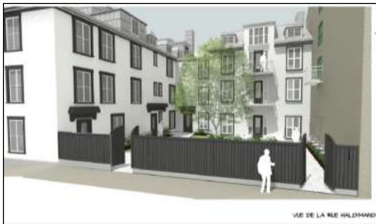
Illustration 6 : Illustration approximative des modifications qui devront être apportées au plan initial de la terrasse (dessin non à l'échelle)