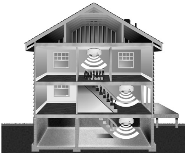
CROQUIS 1 – PRÉSENCE D'AVERTISSEURS À CHAQUE ÉTAGE