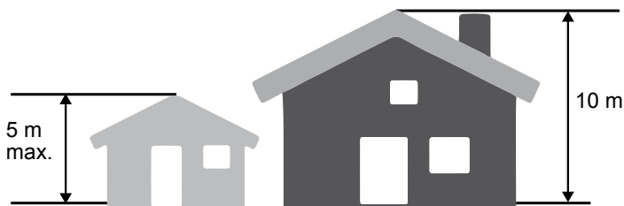
CROQUIS 2 – EXEMPLE DE HAUTEUR