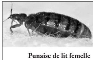
Punaise de lit femelle