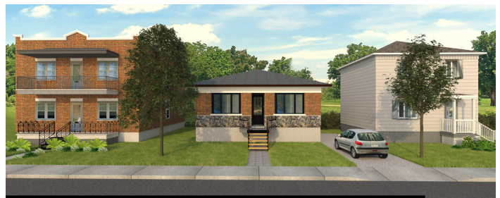
IMAGE 2 – PHOTOGRAPHIE DES BÂTIMENTS ADJACENTS À L'IMMEUBLE VISÉ PAR LA DEMANDE