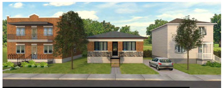
IMAGE 2 – PHOTOGRAPHIE DES BÂTIMENTS ADJACENTS À L’IMMEUBLE VISÉ PAR LA DEMANDE