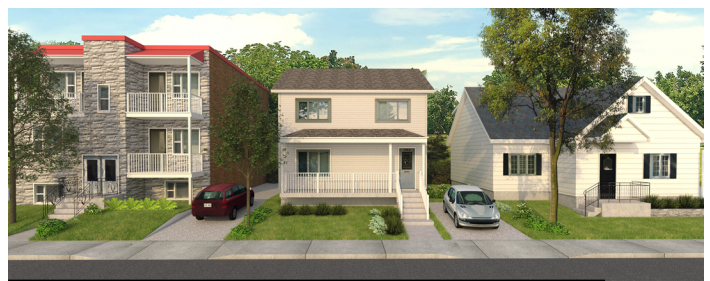
IMAGE 3 – PHOTOGRAPHIE DU BÂTIMENT QUI FAIT FACE À L'IMMEUBLE VISÉ PAR LA DEMANDE ET SES DEUX BÂTIMENTS ADJACENTS