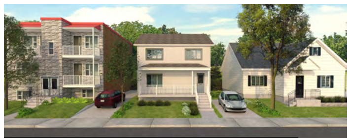
IMAGE 3 – PHOTOGRAPHIE DU BÂTIMENT QUI FAIT FACE À L’IMMEUBLE VISÉ PAR LA DEMANDE ET SES DEUX BÂTIMENTS ADJACENTS