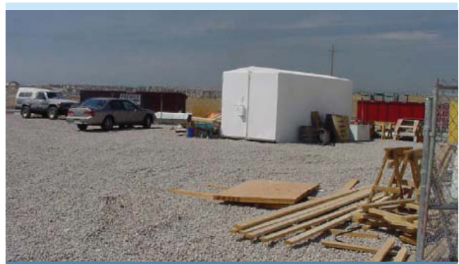
Figure 2. Stabilisation des aires de circulation (UDFCD, 2005)