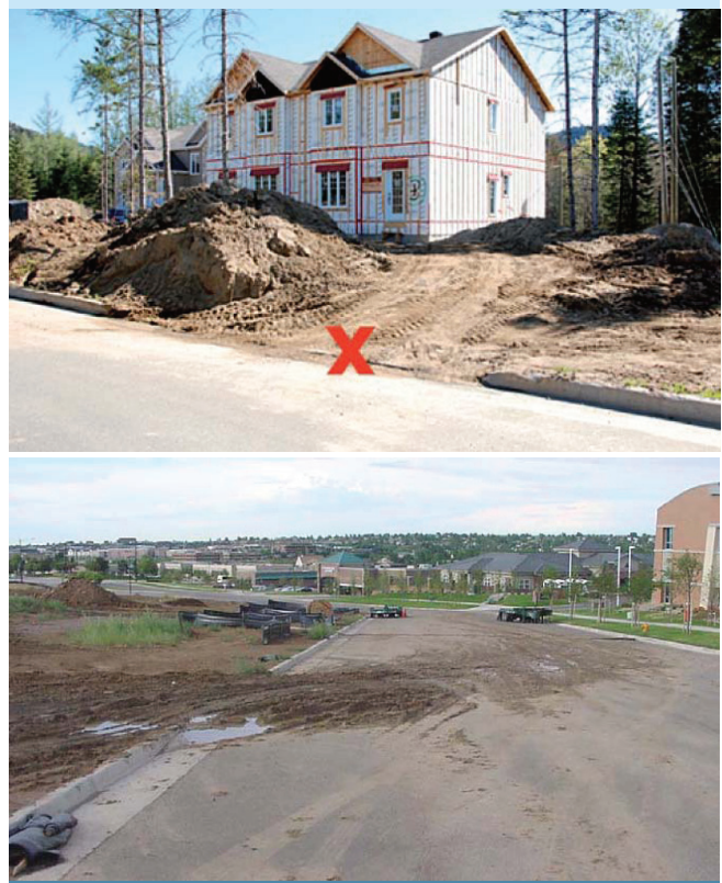
Figure 1. Situations à éviter (APEL, 2005; UDFCD, 2005)

Dans un chantier de plus grande envergure, le nombre d'accès devra être réduit au minimum et ceux-ci devront être stabilisés de façon adéquate. Les camions devront être nettoyés à intervalles réguliers pour minimiser la quantité de sol qui pourrait sortir du chantier de construction. Le nettoyage doit se faire dans des endroits bien circonscrits et de façon à éviter que les eaux de lavage soient évacuées hors du chantier.