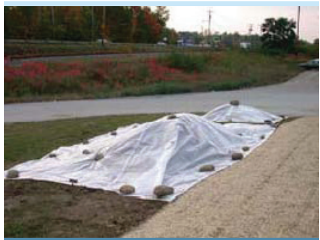
Figure 2. Recouvrement d'une aire de déblais (APEL, 2008)