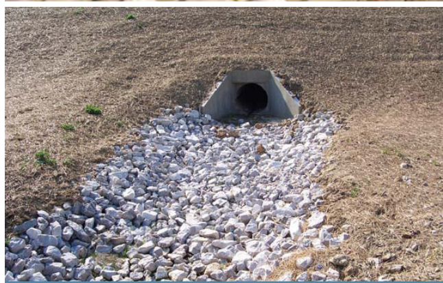
Figure 2. Exemples de protection à la sortie d'un ponceau (Ville d'Edmonton, 2005; UDFCD, 2005)