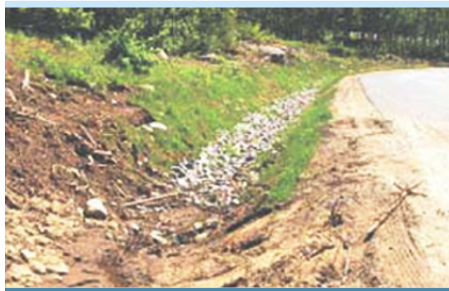
Figure 1. Exemple de fossé non protégé (APEL, 2008)

L'enrochement dans les fossés pourra être combiné à de petites chutes de faible hauteur pour diminuer la vitesse de l'eau dans les zones à forte pente. La figure 4 illustre l'implantation de bermes dans un fossé.