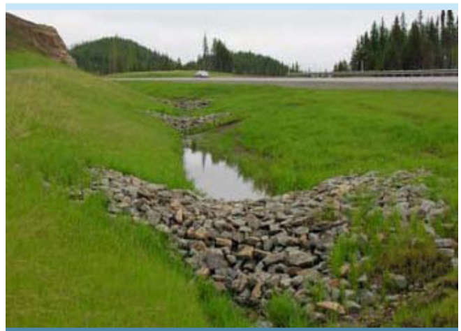
Figure 4. Berme ajoutée en fossé (Abrinord, 2008)